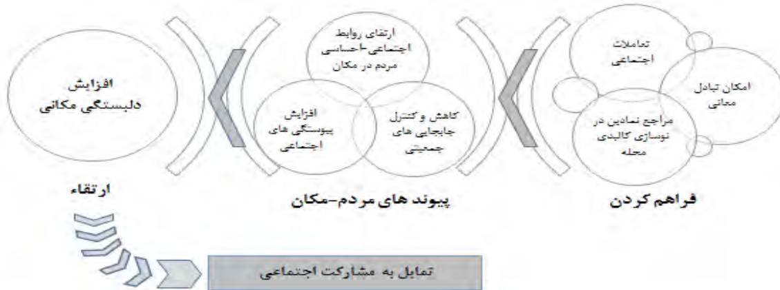
شکل ۳. مکان محوری در بازآفرینی شهری برگرفته از: (گراف، ۲۰۰۸) ۲

ارتقای کیفیت کالبدی و استفاده دوباره از میراث معماری و فراهم آوردن بستری برای پذیرش رویدادهای فرهنگی و فعالیت‌های مبتنی بر فرهنگ و هنر، موجب می‌شود تا تصویر و وجهه بهتری برای شهرها شکل بگیرد (ریچاردز و ویلسون، ۲۰۰۴). ۱ حاصل هم‌افزایی کالبد و کارکرد در بازآفرینی فرهنگ مینا، خود را به صورت زنجیره‌ای شکل گرفته‌ای از مکان‌ها نشان می‌دهد و ترجمان بار معناهای شهری در محیط کالبدی، با کمک عناصر نشانه‌ای و تاریخی، دقیقاً بر همان بروندادی دلالت می‌نماید که مفهوم و زمینه محتوایی «بازآفرینی» بر پایه آن نضج گرفته‌است.