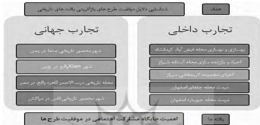
شکل ۲. خلاصه مطالعات تطبیقی