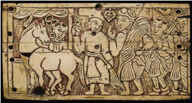
تصویر ۹. لوح منقوش، صحنه جاناکا، افغانستان، بگرام، قرن اول میلادی، عاج، ۵/۸*۱۱ سانتی متر، موزه ملی افغانستان. آلبوم گنجینه‌های باز یافته، ۱۳۸۶.

کاوش قرار گرفته است. مس عینک لوگر، به عنوان یکی از مناطق مهم در حوزه گندهارا، نقاشی‌های دیواری و نقاشی‌های روی فلز و ظروف به دست آمده و نقاشی‌های آن به دو گروه نقاشی‌های تصویری (به شیوه بیانگری) و انتزاعی تقسیم می‌شود (باوری، ۱۳۹۹، ۱۵).