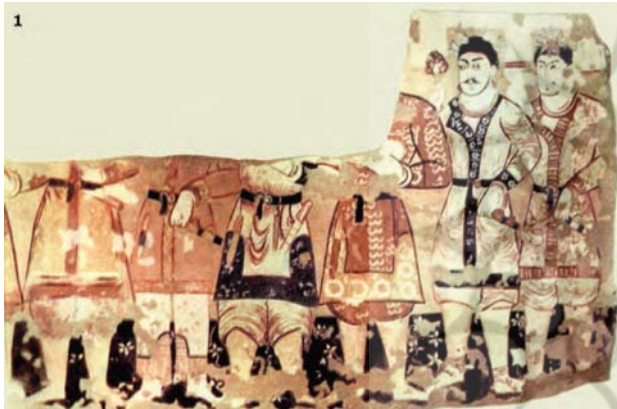
تصویر ۱۳. نقاشی دیواری و تزئینات دیوار شمالی.