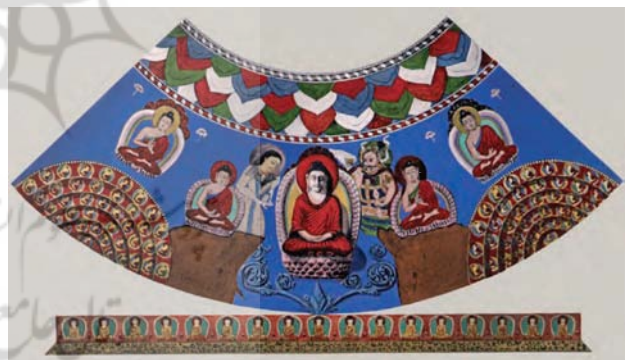
تصویر ۱۶. نقاشی و تزئینات رواق بودای بزرگ، بامیان. مأخذ: Hackin, 1933, 13.