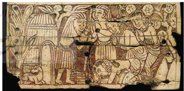
تصویر ۸. لوح منقوش، صحنه جاناکا، افغانستان، بگرام، قرن اول میلادی، عاج، ۵/۸*۱۱ سانتی متر، موزه ملی افغانستان. آلبوم گنجینه‌های باز یافته، ۱۳۸۶.

از نقوش دیواری به رنگ‌های مختلف از صحنه‌های مختلف حیات بودا، خبر داده است. تصاویر ۱۶ و ۱۷، نقاشی سقف رواق بودای بزرگ را نشان می‌دهد.