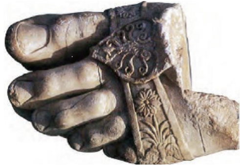
تصویر ۶ مجسمه پای بزرگ از سنگ مرمر، آی خانم، معبد.

هیون تسنگ از انواع مختلف پارچه‌ها مانند «کیاو شی یی»، «وازتسو مو»، «کین پو لو» و «هولالی» (تسنگ، ۱۳۰۱، ۱۳۳) طبری از دیبایهای مروی، هروی و قوهی از افغانستان در قرن هشتم میلادی (طبری، ۱۹۶۷، ۴۶۵)، این اثر از