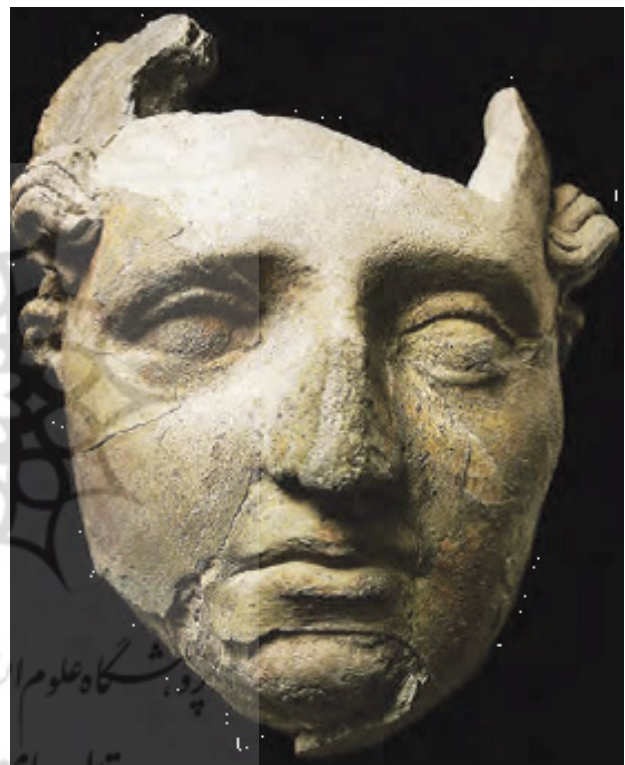
تصویر ۴. چهره مرد از گل خانم، آی خانم، معبد تاقچه‌های دندان‌دار، قرن ۲ قبل از میلاد، ۱۵*۲۱ سانتی‌متر، موزه ملی افغانستان. البوم گنجینه‌های باز یافته، ۱۳۸۶.

هیون تسنگ، در سال ۶۲۳ میلادی از بامیان دیدن کرده و