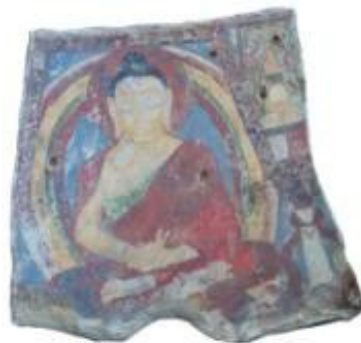
تصویر ۱۷. نقاشی دیواری بودا، ککرک، عصر کوشانی.