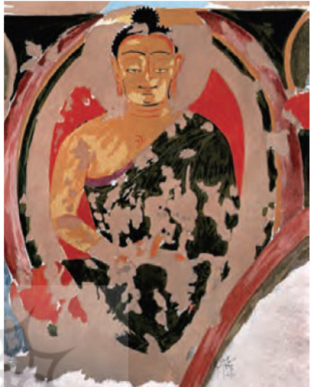
تصویر ۱۵. نقاشی بودا، دره ککرک، بامیان.

سلجوقیان که بیشتر بدوی و بی‌سواد بوده و بسیار دیر با مدنیت خو گرفتند، در افغانستان از ۱۰۳۸ تا ۱۱۵۳ میلادی حکومت کردند که جنگ‌های فتوئالی و تجزیه‌طلبی و تعصبات اشعری