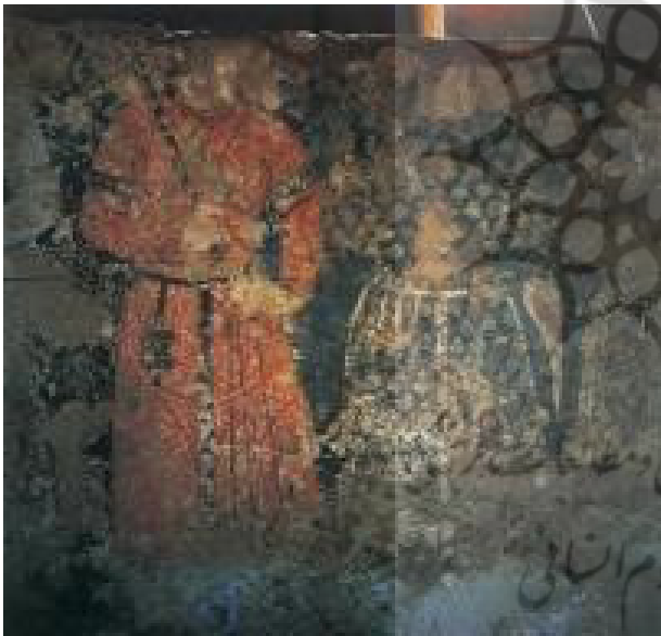
تصویر ۲۲. نقاشی دیواری، دوره مسعود، عصر غزنوی، لشکری بازار، افغانستان.