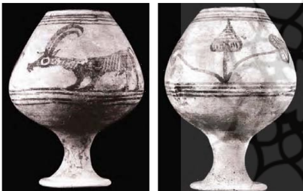
تصویر ۱. ساحه باستانی مندیکک در عصر برنز، بالا: طراحی روی سفال، هزاره سوم ق.م پایین: طراحی بز و طراحی هندسی بر روی فذح‌های سفالی و یک گل‌دان.