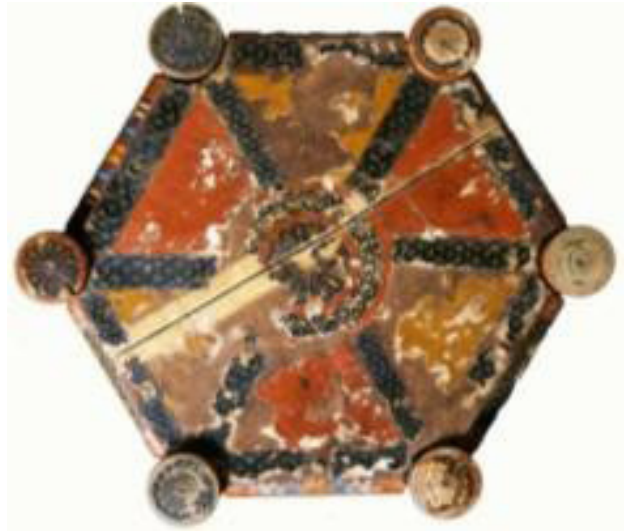
تصویر ۲۳. نقاشی کاغذ و لاک بر روی میز شش‌ضلعی، عصر غزنوی.

(کوهنل، ۱۳۷۸، ۵۲) از مشخصات این مکتب نقاشی است. پس از تجزیه و تقسیم افغانستان در قرن شانزدهم میلادی به دست دولت‌های ازبکی ماوراءالنهر، صفوی ایران و بابر هندوستان، جنبش‌ها و مبارزات سیاسی آزادی‌خواهی و استقلال‌طلبی در افغانستان منجر به طرد دولت صفوی و اشغال ایران توسط امپراتوری هوتکیان (۱۷۰۹-۱۷۳۸) به رهبری میرویس شد (Otfinoski, 2004, 7).