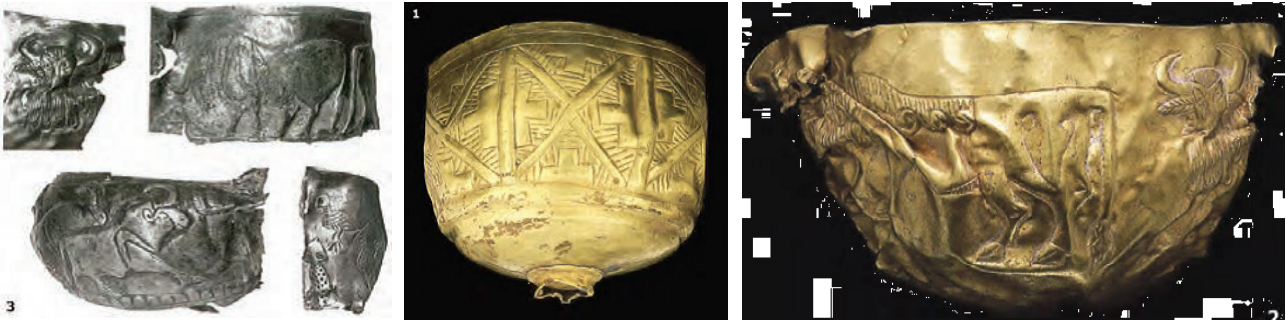
تصویر ۳. تپه فلول، ۱۹۶۶، ظرف طلائی، قرح با نقوش هندسی، جام با نقش گاوهای نر و خوک وحشی. موزه گیمی افغانستان، گنجینه‌های باز یافته، ۱۳۸۶.

سال‌های ۱۹۳۶ الی ۱۹۴۸ انجام شده است. در سال‌های ۱۹۳۷ الی ۱۹۳۹، خزانه یا گنجینه بگرام در دو اتاق لاک و مهر شده کشف شد که پر از آثار ارزشمند ساخته شده از عاج هندی و آثار شیشه‌ای و اشیاء برنجی و نمادهای گچی (دارای منشاء یونانی) بودند (تصاویر ۸ و ۹). از دیگر نقاشی‌های مکشوف کوشانی در افغانستان می‌توان به نقاشی‌های روی شیشه در این گنجینه اشاره کرد (تصاویر ۱۰ و ۱۱).