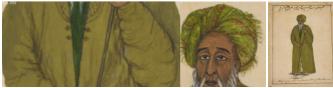
تصویر ۲۴. نقاشی سید میر حافظ جی صاحب، اثر محمد عظیم ابکوم، ۱۸۵۴، آبرنگ مات (opaque watercolour) بر روی مقوا، محل نگهداری: انگلستان، British Library. مأخذ: رفیعی راد، ۱۴۰۱، ۹۹.