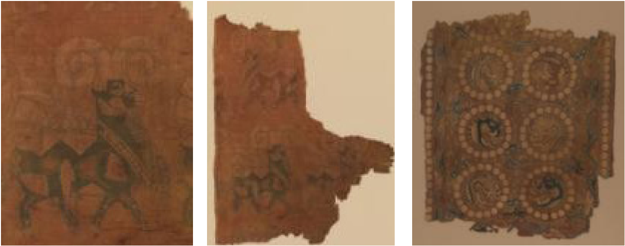
تصویر ۲۰. سمت راست: پارچه ابریشمی، قرن هفتم و هشتم میلادی، افغانستان، موزه مترو پلیتن، شماره دسترسی: ۲۰۰۴/۲۶۰، وسط و چپ: پارچه ابریشمی قرن هشتم میلادی، افغانستان، شماره دسترسی: ۲۰۰۵/۱۳۴.