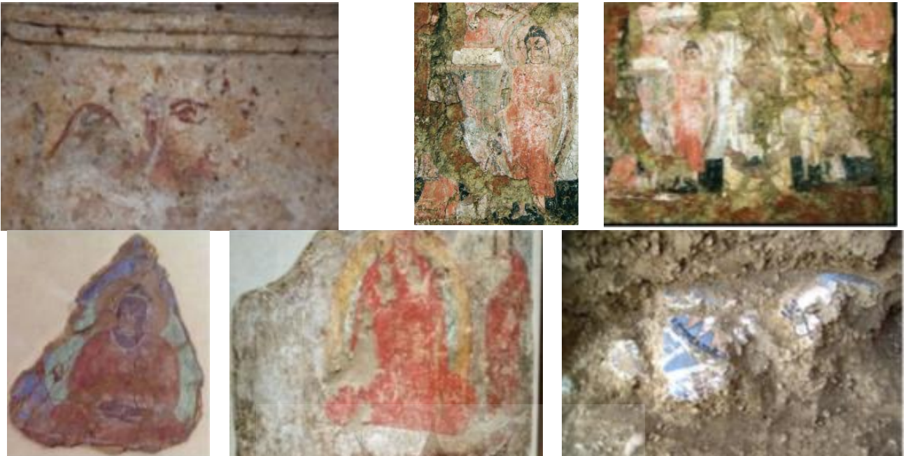
تصویر ۱۸. نقاشی‌های به‌دست‌آمده از مس عینک و سوات.