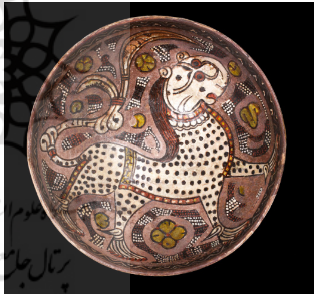
تصویر ۲۱. نقاشی بر روی کاسه سفالی، زیرلعابی شفاف، عصر سامانی، افغانستان (موزه مترو پلیتن، شماره دسترسی، ۱۹۸۰/۵۲۴). مأخذ: https://toosfoundation.com/samanid-dynasty .

و دارای افق بلند و جبال اسفنجی، همچنين استهلاک نفوذ خارجی و ویژگی‌های ملی و بومی (Sabahat, 2019, 151) رهایی از شیوه معمولی مغولی (رفاعی، ۱۳۸۶، ۴۱) کار بر ترکیبات رنگی طبیعی، ابداع تک‌چهره (Miran, 2016, 124) آغاز کاریکاتور چهره، تلاش در نمایش احوالات درونی فیگور و نیز ارائه دیدگاه رئالیستی به جامعه، کاربرد فراوان معماری به مردانوف، عنوان نظم‌دهنده ساختار نگاره و جایگاه حضور شخصیت‌های نگاره (محمدزاده و مسینه اصل، ۱۳۹۵، ۲۷) و بازنمایی نهر یا جوی آب با رنگ نقره‌ای که به شکل مارپیچ