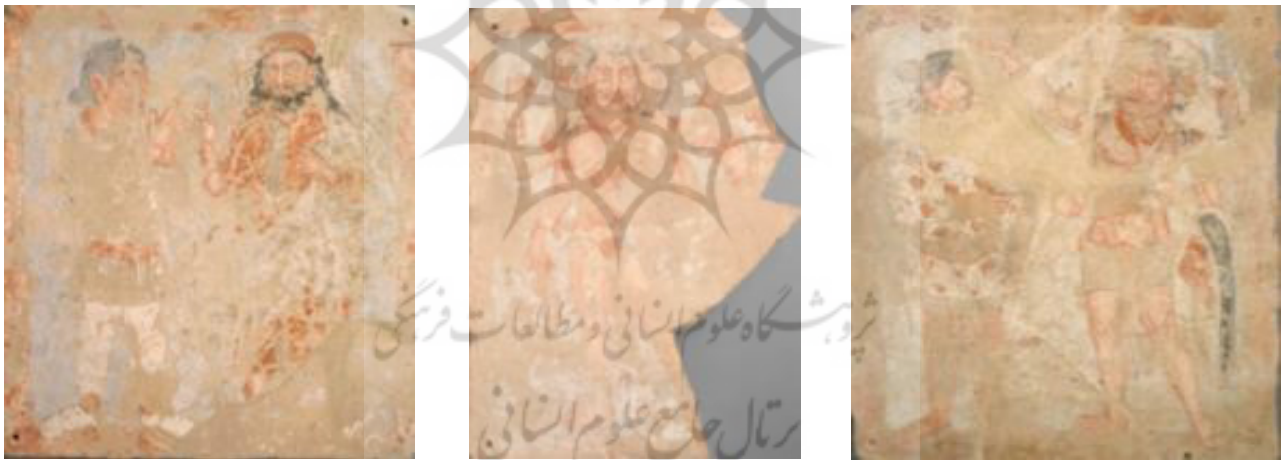
تصویر ۱۹. سه اثر نقاشی بر روی سفال با رنگ گواش، عصر کوشانی، موزه متروپلیتن، سمت راست: ابعاد 57/2 cm x 53/3 x 5/7 cm شماره دسترسی ۲۰۰۰/۴۲/۳، وسط: ابعاد H. ۵۷/۲ cm, W ۴۱/۶ cm, D ۵/۷ cm شماره دسترسی ۲۰۰۰/۴۲/۴، چپ: ابعاد H. 56/8 cm, W. 52/3 cm, D. 5/4 cm شماره دسترسی ۲۰۰۰/۴۲/۲

با حمله مغول در قرن سیزدهم، آن سلسله نیز براندازی شد. مقدمات انحطاط فرهنگی افغانستان از قرن یازدهم میلادی در طی جنگ‌های سیصدساله با علمای معقول و فلسفه با اقوام جدیدالاسلام نظیر غزنوی، سلجوقی و خوارزمی چیده شد. از زمان استیلای مغول تا هجوم امیر تیمور گورکانی در قرن چهارده و پانزده میلادی، افغانستان یک قرن و نیم در حالت تاریکی مطلق مادی و معنوی به سر برد.