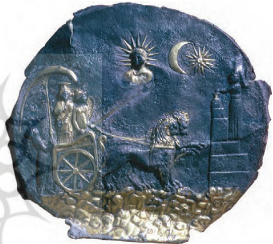
تصویر ۷. بشقاب نقره طلاکوب سیبل به شیوه یونانو باختری.