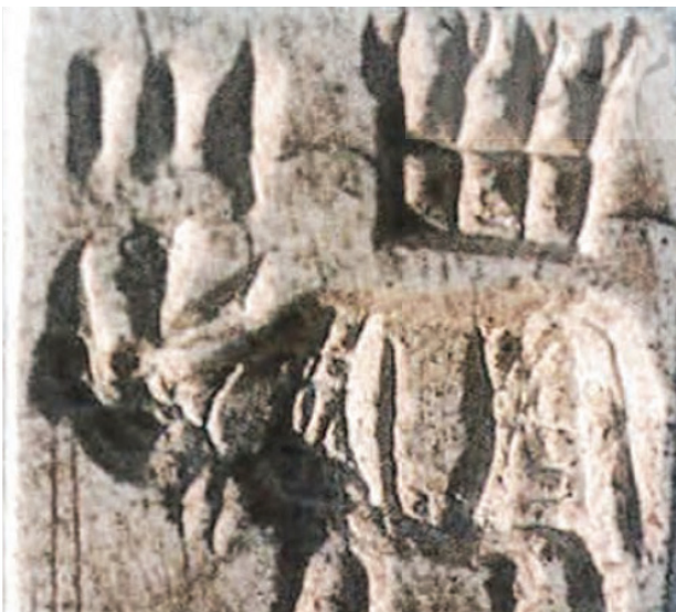
تصویر ۲. مهر سنگی، کشف شده از ولایت تخار، منطقه شورتوقی.

سال ۱۹۶۳م در دره کلان و نیز دوران کهن سنگی جدید توسط لوپس دوپری در سال ۱۹۶۶ در منطقه آق کپرک انجام گرفته صرفاً شامل کاربردی بدون نقش و سر مجسمه و تزئینات زیگزاگ است.