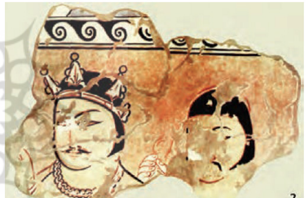
تصویر ۱۲. نقاشی دیواری یکی از سرداران یا شاهزادگان.

گیاهان و خوشنویسی بود که نشان از طراحی اسلامی آن دارد (زکی، ۱۳۶۳، ۲۳۰). تصویر ۲۰. پارچه ابریشمی با نقاشی بافته شده از سر گراز در حلقه‌های مروارید و طاووس، که در غارهای بودایی بامیان یافت شده و تحت تأثیر هنر ساسانی است. همچنین در تصویر دیگر، نقش بز بر روی پاچه ابریشمی، بر شیوه ساسانی آن تأکید دارد.