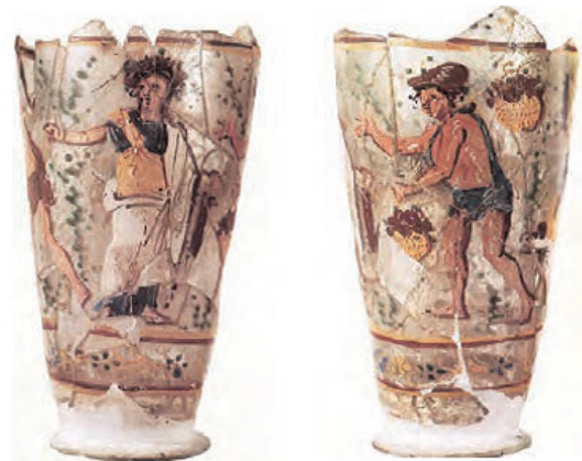
تصویر ۱۰. جام شیشه‌ای نقاشی شده، هنر کوشانی، بگرام، افغانستان، قرن اول میلادی، ارتفاع ۱۲/۶، قطر ۸ سانتی‌متر، موزه ملی افغانستان. آلبوم گنجینه‌های باز یافته، ۱۳۸۶. مأخذ: Sarmiento & Rasouli, 2018.