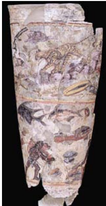
تصویر ۱۱. جام شیشه‌ای نقاشی شده، صحنه شکار و ماهی‌گیری، هنر کوشانی، بگرام، افغانستان، قرن اول میلادی، ارتفاع ۲۴/۷، قطر ۱۱/۷ سانتی‌متر، موزه ملی افغانستان. آلبوم گنجینه‌های باز یافته، ۱۳۸۶.