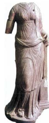
تصویر ۵. مجسمه زن از سنگ آهک، آی خانم، معبد.