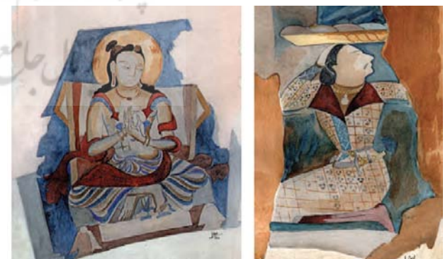
تصویر ۱۴. سمت راست نقاشی دیواری رواق بودای بزرگ، در دست چپ، هدیه‌دهنده، هدیه اش را با دست بالا گرفته است. سمت چپ: در بالای سر بودا در سقف رواق، یک بودیستوا را نشان می‌دهد. بامیان، قرن اول میلادی. مأخذ: Hackin, 1933, 12.

دوره صفاری، عهد انکشاف و استحکام مؤسسه سیاسی دولت و بسط امنیت بود. همچنین فتوادلیسم افغانستان از قرن