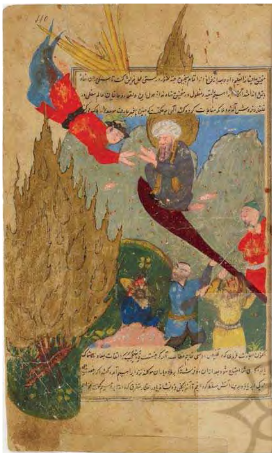
تصویر ۴: ابراهیم در آتش، روضه‌الصفاء، سده ۹ ه.ق، کتابخانه ملی فرانسه، مأخذ: http://gallica.bnf.fr

حضرت ابراهیم(ع) با هاله دورسرسر و بدون روپنده در میان بوستانی که دور آن را آتش فرا گرفته، نشسته و به نشانه دعا و شکر، دستان خود را بالا نگه داشته است. این نگاره، صحنه‌ای جاندار و با روح را نشان می‌دهد (آژند، ۱۳۸۷: ۲۰۱). نمرود بر تخت خود نشسته و ناظر واقعه است که این امر با آنچه در متون تفسیری بیان شده، متمایز است. این نگاره که دارای فضای روایتگر است؛ تا حدودی نزدیک به نگاره جامع‌التواریخ با همین موضوع است. از حیث محل قرار گیری شخصیت‌ها و منجیق، شکل دایره‌ای آتش، نحوه نشستن نمرود این شباهت را می‌توان مشاهده نمود. با این حال، نگاره معجزه سرد شدن آتش برای حضرت ابراهیم(ع) در گلچین اسکندر سلطان، دارای جزئیات بیشتر، ظریف‌تر و در یک ترکیب دو صفحه‌ای ترسیم شده است. همچنین می‌توان دید، در این نگاره، معجزه سرد و سلامت شدن آتش برای حضرت ابراهیم(ع) با گل و بوته‌های بیشتر نسبت به نمونه آن در جامع‌التواریخ به تصویر در آمده است.