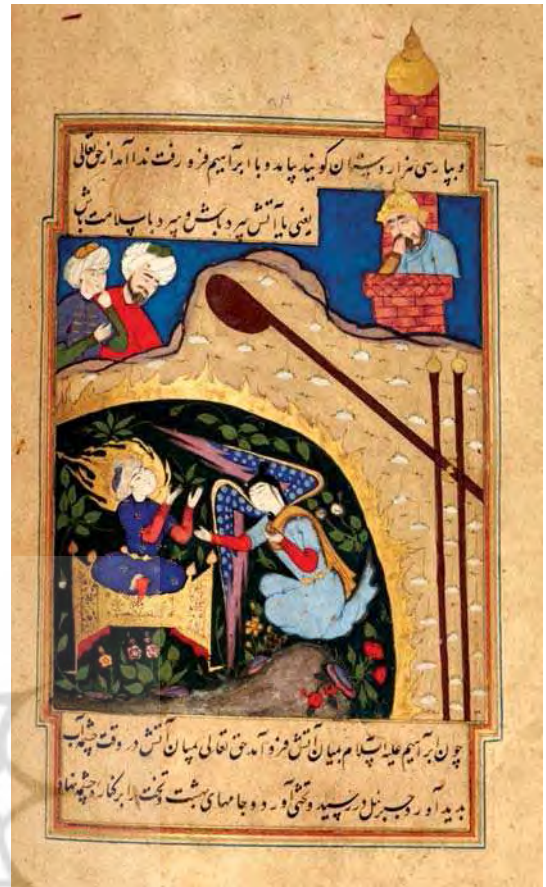
تصویر ۷. ابراهیم در آتش، قصص‌الانبیاء، مجموعه کی‌یر، لندن، Milstein & Others, 1999: 281 مآخذ:

در جدول (۲) عناصر تصویری نگاره‌ها بررسی شده است. این عناصر تصویری با در نظر گرفتن متن قرآن و هم‌چنین آنچه نگارگران ترسیم کرده‌اند، انتخاب شده است که با تحلیل این عناصر و تطبیق آن با متن قرآن و تفاسیر، میزان ارتباط تصاویر هر یک از نسخ خطی با آیات قرآن و تفاسیر بررسی می‌شود.