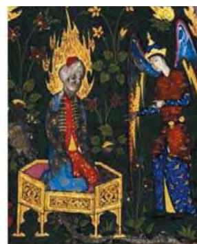
بخشی از نگاره ۵