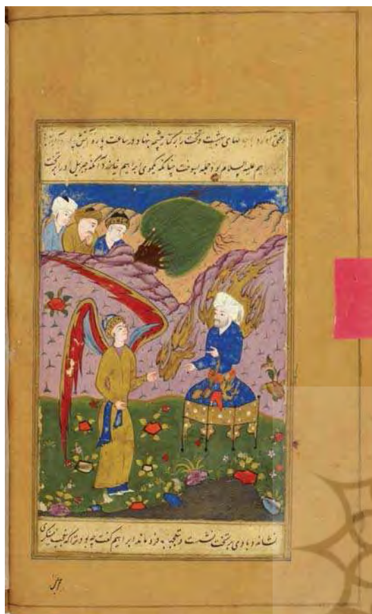
تصویر ۶. ابراهیم در آتش، نسخه ۱۳۱۳ قصص الانبیاء، کتابخانه ملی فرانسه، مأخذ: http://gallica.bnf.fr

تصویر (۷) متعلق به نسخه قصص الانبیاء محفوظ در مجموعه کی‌یرا در لندن است. در بالا و پایین تصویر، متنی از اسحاق نیشابوری دیده می‌شود. یک عنصر معماری به شکل مناره در گوشه سمت راست ترسیم شده و بر بالای آن نمود با تاجی بر سر ناظر واقعه است و از تعجب انگشت به دهان گرفته است. در سمت راست، منجنیقی که دسته آن به صورت مورب ترسیم شده، قرار دارد. ابراهیم با شعله مقدس و بدون روبند بر روی تختی نشسته و دست دعا بلند کرده است و در کنار تخت او نهری روان است. در این نگاره نیز فضای زیادی به گلستان شدن اختصاص یافته و آتش به صورت شعله‌های کوچکی اطراف آن را احاطه کرده است. در مقابل ابراهیم(ع)، جبرئیل به شکل فرشته‌ای بالدار تصویر شده که دستان خود را به سمت ابراهیم گرفته است.