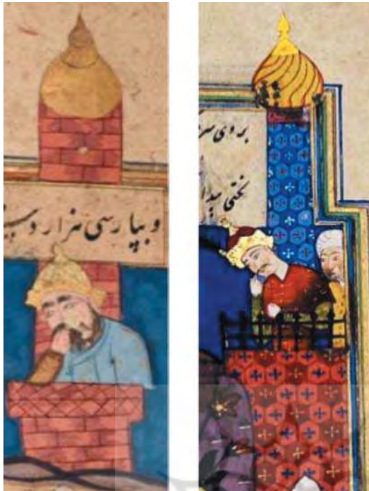
تصویر ۱۰. جایگاه نمرود، بخشی از نگاره ۷ بخشی از نگاره ۵

با توجه به جدول (۳)، از میان نگاره‌های که با عنوان معجزه سرد و سلامت شدن آتش برای حضرت ابراهیم (ع) یافت شده است، اکثر نگاره‌ها تا حدودی بر متن قرآن و متون تفسیری وفادار مانده‌اند و از این میان می‌توان گفت تنها در سه نگاره که متعلق به دوره صفوی است، نگارگر عناصر تصویری را منطبق بر متن قرآن و تفاسیر ترسیم کرده است.