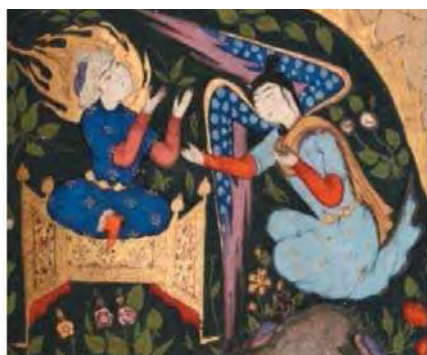
بخشی از نگاره ۷

صورت گرفته است و از این میان، عناصری مانند جبرئیل، تخت ابراهیم، لباس بهشتی و نهر آب و کتیبه را می‌توان نام برد. در نگاره‌های نسخ قصص الانبیاء بخشی کوچکی از تصویر، آتش ترسیم شده است و فضای بیشتری را به بوستان شدن آتش اختصاص داده‌اند. به عبارت دیگر در این نگاره‌ها، تصویر آتش به صورتی که بزرگی آتش را نشان دهد، ترسیم نشده است. گویا نگارگران بیشتر درصدد بیان قدرت خدا و زیبایی این معجزه بودند. در دو نگاره ابراهیم در آتش از مرقع دی‌یز (تصویر ۲) و روضه‌الصفاء (تصویر ۴)، حضرت ابراهیم، در آسمان و در لحظه پرتاب شدن به آتش ترسیم شده است و در سایر نگاره‌ها حضرت ابراهیم در میان شعله‌های آتش دیده می‌شود. در نگاره مرقع دی‌یز آتشی بزرگ، ترسیم شده و حضرت ابراهیم معلق در آسمان، در حال افتادن در آتش