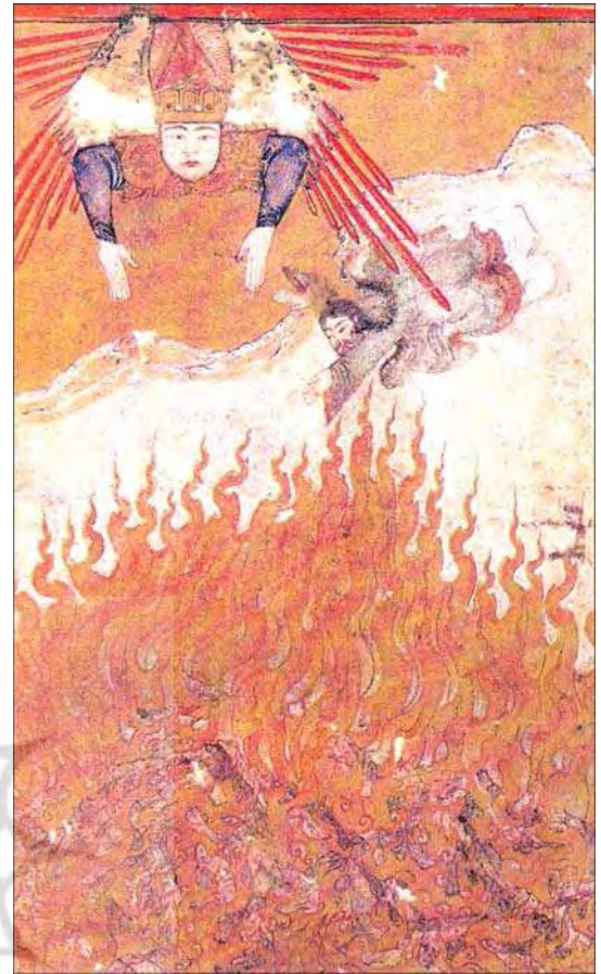
تصویر ۲. ابراهیم در آتش، مرقع دبیز، شیراز، ۸۰۲-۸۲۸ ه.ق، کتابخانه ملی برلین، مجموعه دیتیس، مأخذ: آژند، ۱۳۸۷: ۲۴۲

دیگران، ۱۳۹۵: ۳۱) که برای کتابخانه اسکندر سلطان کار می‌کرد. نگاره‌های این گلچین، نگارگری مکتب شیراز را نشان می‌دهد (آژند، ۱۳۸۷: ۲۰۰). کاتب دلیل گردآوری این اثر ادبی و تاریخی را آگاهی از چگونگی حکومت اسکندر سلطان بیان می‌کند. اسکندر سلطان همچنین، به قوانین اسلام و الهیات علاقه‌مند بود (احمدپناه و دیگران، ۱۳۹۵: ۳۳) و تصویر امامان شیعه در برخی نگاره‌های این نسخه گویای گرایش شیعی (مذهبی) اسکندر سلطان است (آژند، ۱۳۸۷: ۲۰۱). بدین ترتیب اسکندر سلطان از هنر و هنرمندان حمایت می‌کرد و گلچین اسکندر سلطان نمونه‌ای از کتب ادبی دوران او است. این نسخه، شامل مجموعه‌ای از اشعار شاعرانی از جمله خمسه نظامی، عطار نیشابوری و... است و امروزه در بنیاد گالوست گلبنکیان در لیسبن قرار دارد. این گلچین شامل ۳۴ نگاره و ۴۴۴ برگ است و تحت شماره LA۱۶۱ نگهداری می‌شود (آژند، ج ۱، ۱۳۸۹: ۴۲۷).