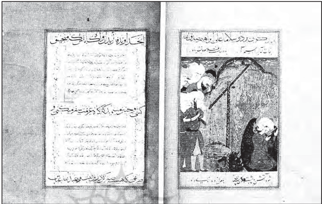
تصویر ۸. ابراهیم در آتش، فالنامه فارسی توپقایی سرای، ۹۶۵ ه. ق. به بعد، موزه توپقایی سرای استانبول، مأخذ: FarhadandBagci, 2009: 285.

بودند، رفت و حضرت ابراهیم (ع) را در بوستانی خرم دید. این موضوع در دو نگاره نسخه ۳ قصص الانبیاء (تصویر ۵) و نگاره موجود در مجموعه کی‌یر قصص الانبیاء (تصویر ۷) می‌توان دید که نمرود را بر بالای بنایی به شکل مناره در حال نظاره ابراهیم نشان می‌دهد (تصویر ۱۰). در دو نگاره نسخه ۱۳۱۳ قصص الانبیاء و فالنامه، نمرود از بالای تپه ناظر ماجراست.