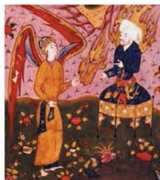
بخشی از نگاره ۶