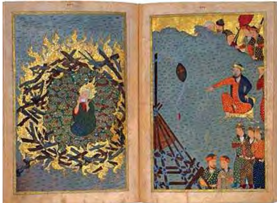
تصویر ۳. ابراهیم در آتش، گلچین اسکندر سلطان، شیراز، ۸۱۳ ه.ق، بنیاد گالوست گلبنکیان در لیسبن پرتغال، مأخذ: http://Sabanciuniv.edu