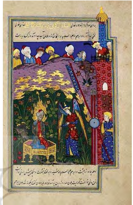
تصویره. ابراهیم در آتش، نسخه ۳ قصص الانبیاء، شیراز (صفوی)، ۹۸۴ هـ.ق، کتابخانه ملی آلمان برلین

این نگاره شامل دو کتیبه در بالا و پایین تصویر است که کمی کوچک‌تر از پهنای کادر می‌باشند. کتیبه‌ها، متن قرآنی که به معجزه حضرت ابراهیم اشاره دارد به همراه متنی