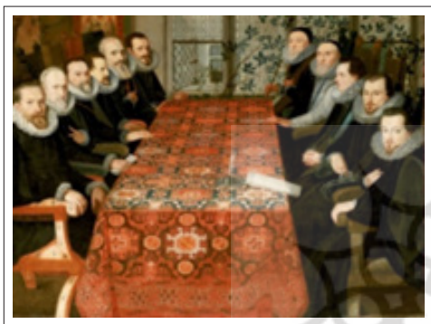
تصویر ۱. نقش فرش هولباین در نقاشی مربوط به ۱۶۰۴ م. با عنوان کنفرانس در خانه سامرست (URL3)

پژوهشگران و نویسندگان متعددی این روش پژوهشی را در رابطه با تاریخ فرش به کار گرفتند. در ایران نیز منابع تصویری مربوطه، نگاره‌های به‌جا مانده از دوران ایلخانی، تیموری و صفوی هستند که بخش وسیعی از تاریخ فرش ایران را آشکار می‌کنند، کتاب فرش بر مینیاتور نوشته استاد علی حصوری از آثار به‌نام این عرصه است. «مینیاتور با تحولاتی که در قرن هشتم پیدا می‌کند رفته‌رفته به سمت واقع‌گرایی پیش می‌رود و شاید مینیاتورهای پیش از این دوران منبع موثقی برای قالی ایرانی نباشند» (حصوری، ۱۳۷۴: ۱۳). (تصویر ۲)