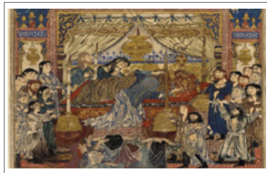
تصویر ۴. نقش قالی هندسی با واگیره تکرار شونده. نگاره‌گریه بر مرگ اسکندر. شاهنامه دموت (URL2)

با مطالعه و بررسی تاریخ فرش در کتاب‌های قرن چهارم تا هشتم هجری قمری، این نتایج و نظریات حاصل می‌شوند: قالی دست‌باف در قرن چهارم قمری تا قرن‌ها بعد، کالایی با ارزش و گران‌قیمت بوده است و بخشی از شکوه و جلال قصرهای پادشاهان. برخلاف فرضیه ابتدایی تحقیق، نویسندگان و مورخان از نقوش و تصاویر قالی‌ها مطلبی نگفته‌اند و تنها به ذکر جنس الیاف و رنگارنگ بودن آن اکتفا کردند. از ظرافت، زیبایی و نقوش بیان شده پارچه‌ها در منابع مکتوب، هم‌چنین در نگاره‌ها و تکه‌پارچه‌هایی به جای مانده، می‌توان چنین گمان کرد و گفت: نقوش پارچه‌ها و منسوجات، بر نقوش قالی‌های دست‌باف تأثیر گذار و از منابع مهم آن نیز بوده است و هم‌چنین نقوش قالی‌ها به واسطه هندسی و تکراری بودن قابلیت وصف و شرح نداشتند که