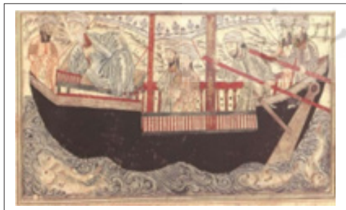
تصویر ۳. نوح و پسرانش در کشتی، نسخه‌ای از جامع التواریخ ایلخانی (صداقت و خوشیدی، ۱۳۸۸: ۸۱)

۶. جامع التواریخ : کتابی برجسته در ارتباط با تاریخ مغول، تألیف در سال ۷۱۰ق، در این کتاب به فرش دست‌باف خیلی کم اشاره شده است، ولی باارزش بودن آن به‌عنوان یک کالا و همچنین شغل و منصب فراش در مواردی ذکر شده است. (تصویر ۳)