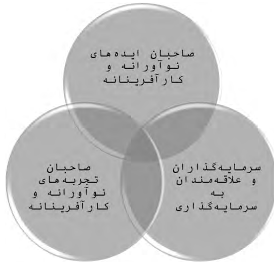
شکل ۲. مخاطبان رویداد

بر اساس این توضیحات، هریک از این سه دسته را می‌توان به اجزای بیشتری تقسیم‌بندی کرد. این اجزا در قالب جدول ۳ ارائه شده است.