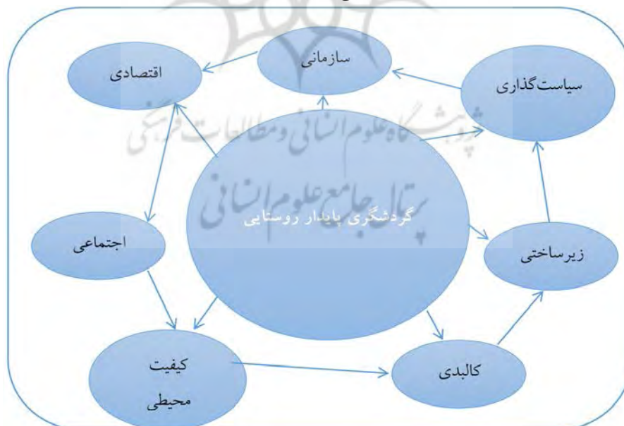
شکل (۱) مدل مفهومی موانع و چالش‌های توسعه گردشگری پایدار

در نهایت با شناسایی و کشف مضامین سازمان دهنده و پایه‌ای و در یافتن روابط بین موضوعات اصلی، نمودار تشریح ویژگی‌ها و عوامل مؤثر جهت تبیین موانع و چالش‌های پیش روی گردشگری روستایی را به شکل زیر می‌توان ترسیم کرد: