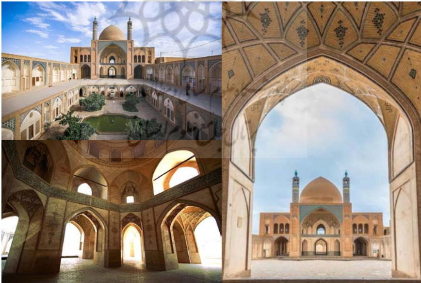
تصاویر ۴، ۵ و ۶: مسجد آقا بزرگ، (حیدری، ۱۳۹۷)

شبستان: این مسجد دارای سه شبستان می‌باشد. شبستان زمستانی در قسمت شمال حیاط قرار دارد و ستون‌هایی از آجر و سنگ دارد. روزنه‌هایی که در پوشش سنگی بنا وجود دارند، نور شبستان را تأمین می‌کنند. شبستان دوم در جبهه جنوبی قرار دارد و به صورت نیم‌طبقه‌ای است که این قسمت به عنوان مسجد استفاده می‌شود و شکستگی‌های سقف نور شبستان را تأمین می‌کند. شبستان غربی بعداً اضافه شده و دارای بیست ستون آزاد و سی چشمه طاق آجری است.