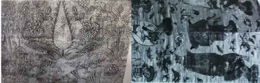
تصویر ۵: پارچه ساتن با نقش گل و پرنده، سده ۱۱ق، یزد، (پوپ و اکرم، ۱۳۸۷: ۱۰۹۷)