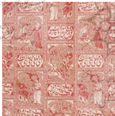
تصویر ۶: پارچه دوروز ابریشم، قرن ۱۰ هجری، (فتحی، ۱۳۸۶: ۶۹)