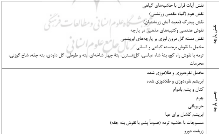
جدول ۴: ویژگی‌های منسوجات در دوره‌های سوم و چهارم قاجار، (مونسى سرخه، ۱۳۹۶: ۵۵)

دوره سوم شامل ۳۰ ساله دوم سلطنت ناصری و اوایل فرمانروایی محمدعلی شاه قاجار است. در این زمان، وابستگی ایران به کشورهای دیگه تشدید شد. ورود پارچه‌ها و کالاهای ایرانی فزونی یافت. عادت به خرید پارچه‌های خارجی و استفاده از آن‌ها در دوخت لباس میان گروه‌های مختلف مردم رواج یافت. دوره چهارم ۱۴ سال پایانی قاجار است که فرمانروایی محمدعلی شاه و احمدشاه قاجار را شامل می‌شود. در این دوره، بسیاری از صنایع داخلی رو به افول نهاد و ایران مملو از کالاهای تولیدی کشورهای غربی شد. در این عصر، بافت پارچه‌های زریفت متوقف می‌شود و استفاده از البسه اروپایی بیش از پیش توسط زنان رواج پیدا می‌کند. از جمله پارچه‌های گران بهاء این دوره شال کرمان بود. افراد معمولی از پارچه‌های ارزان