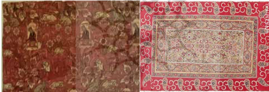
تصویر ۲: پارچه عتیقه ایرانی (قرن ۱۷ میلاد) تصویر ۳: مخمل صفوی، رضا عباسی، (پوپ و اکرمین،

اولین پادشاهان صفوی، میراث‌دار هنر پارچه‌بافی تیموری بودند و حمایت از پارچه‌بافی و هنرمندان، مورد توجه شاهان صفوی قرار گرفت. در این دوره، سبک‌های هنری گذشته به حیات خود ادامه داد؛ اگرچه تحولاتی نیز تحت‌تأثیر هنرمندان در عرصه‌های گوناگون هنری به وقوع پیوست. سبک هنری در این دوره، اقتباسی از هنر دوره مغول و تیموری در ایران بود (توسلی، ۱۳۸۷: ۸۹). سلطان محمد مدیریت کارگاه هنری تبریز را برعهده داشت و به طراحی نقوش قالی، پارچه و ظروف می‌پرداخت. سبک هنری او، در به تصویر کشیدن اشخاص بر روی پارچه‌های ابریشمی قابل تشخیص است (محمدحسن، ۱۳۷۷: ۸۴).