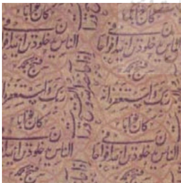
تصویر ۷: پارچه زری دارایی، متعلق به پوشش قبر، قرن ۱۱ هجری، (فتحی، ۱۳۸۶: ۷۱)

سنتی نقاشی ایران در آمیخت و در عهد ایلخانی با هنر نقاشی چینی آمیخته و در عهد صفوی، با ذوق هنرمندان تلطیف شد» (روحفر، ۱۳۸۰: ۷۷). دوره صفوی از درخشان‌ترین دوره‌های ترقی و تکامل خطوط مختلف ایرانی به‌خصوص ثلث و نستعلیق و نسخ بوده است؛ به‌طوری‌که بسیاری از پادشاهان در این زمان، خود خوشنویس بوده و یا علاقه‌مند به این هنر بودند (تصویر ۶). تزیین پارچه‌ها در عصر صفوی عبارت بودند از نقوش انسانی و حیوانی و پرندگان و گل و گیاه با موضوعاتی از داستان‌های رزمی و بزمی اقتباس شده از شاهنامه و نظامی‌گرایی به جنبه تصویری در پارچه‌ها در عصر صفوی چنان قوت گرفت که یکی از مشخصه‌های آشکار پارچه‌های ایرانی در این عصر گردید. بین تزیینات پارچه و نقاشی‌ها و نقش و نگارهای کتاب‌های خطی، پیوند و رابطه نیرومندی پدید آمد. بر پارچه‌های قلمکار این عصر، آیات قرآن و دعا و احادیث با خطوط کوفی، نسخ، ثلث و غبار نقش می‌شدند که از نمونه این پارچه‌ها، پیراهن‌هایی با محتوای آیه الکرسی یا دعای نادعلی برای رفع امراض و بلایا می‌باشند. پارچه‌هایی نیز با روش دوخته‌دوزی بودند که با توجه به کاربرد نوع خط رایج، به بیان آیات قرآن، دعا، احادیث، اشعار و ضرب‌المثل‌ها و گاه نام بافنده و یا سفارش دهنده بر روی آن می‌پرداختند. در کل، می‌توان اشاره کرد که استفاده از موضوعات داستان‌های ایرانی از دوره سلجوقی بر پارچه‌ها رایج شد و در دوران تیموری و صفوی، به دلیل نزدیکی نقاشی و کتاب‌سازی به پارچه موضوعات داستان‌های حماسی و عاشقانه از رکن‌های اصلی تزیین پارچه شد (روحفر، ۱۳۸۶: ۷۷). زری نوشته‌دار از پارچه‌های رایج دوران صفویه بوده است. غالباً این