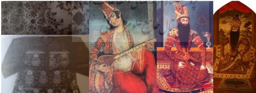
تصویر ۸: فتحعلی شاه، مهر علی، کاخ موزه گلستان / تصویر ۹: فتحعلی شاه، رنگ روی بوم، مجموعه خصوصی / تصویر ۱۰: مرد جوان با ساز، احمد نقاش، سده سیزدهم، موزه هنرهای زیبا جورجیا / تصویر ۱۱: ابریشم ساده بافت، قرن ۱۹، با نقوش گیاهی، حیوانی و انسانی، (Baker, 1995: 129) / تصویر ۱۲: بلوز زنانه ابریشمی با طرح گلدار، (بیکر، ۱۳۸۵: ۱۴۰)

عصر فتحعلی شاه قاجار را دوره شیوع نقوش هندسی در هنر پارچه‌بافی سنتی دانسته‌اند. در حالی که به واقع این طرح هندسی است که در مایه‌های قابی، خستی و محرمت نضج می‌یابد و بستر حضور نقوش گیاهی را فراهم می‌آورد. شواهد تصویری نشان می‌دهد در این دوره حتی طرح‌های هندسی منتظم پدیدار نمی‌شود؛ مگر آنکه در بیشتر مواقع به زیور نقش آرایش بیابد. در این میان، برخی دیگر نیز نقوش گیاهی تجریدی همچون نقش روکش پستی (تصویر ۸) یا نقش پوشش فتحعلی شاه (تصویر ۹) را به نقوش هندسی تعبیر کرده‌اند. یکی از تصویرهایی که شاید گواه بر کاربرد هر چند اندک نقوش هندسی در این دوره باشد، جُبه