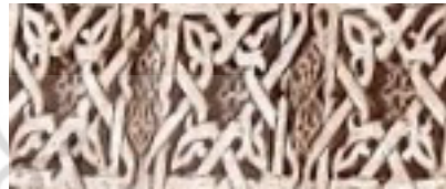
تصویر ۳: تزیینات هندسی گچی ایوان جنوبی، (چنگیز، ۱۴۰۱)

در عصر انسان‌های نخستین، آتش جایگاه پراهمیت و ضروری را دارا بوده که به‌وسیله آن ایجاد نور و گرما و انجام امورات روزمره، از قبیل پخت و پز را انجام می‌دادند و این برافروختگی آتش با نهادن دو قطعه چوب به‌صورت متقاطع بر روی هم صورت می‌گرفته است. از همین رو، نقش نور و آتش برای انسان‌ها مهم بوده و نقش چلیپایی که نمودی از دو چوب روی هم قرار گرفته به‌جهت ایجاد آتش، از آن زمان در جوامع جایگاه ویژه را تصاحب می‌کند. نقش چلیپا برای اولین بار در هزاره پنجم پیش از میلاد در منطقه خوزستان مشاهده شده و همچنین در بسیاری از تمدن‌های باستانی در سرتاسر جهان این نماد کاربرد داشته است. با توجه به قدمت نماد چلیپا در دوره باستان این نماد بیان‌گر خوشبختی و درمان‌گری یا به‌عبارتی آن را نشانی از خدایان نگهبان بر مخلوقات می‌دانستند که از نیروهای مضر اهریمنی و پلید جلوگیری می‌کرده و مانع چشم‌زخم‌ها و آسیب‌ها بر انسان‌ها و جانوران می‌شده است. این نقش به‌چهار نیروی باد، خاک، آب و آتش نیز که پایه تمام نیروهای هستی و اثرات آن بر انسان‌ها بوده اشاره داشته است. با توجه به کاربرد چلیپا، در بسیاری از تمدن‌ها از جمله مصر، یونان، روم، چین، بودا، سرخپوستان ناواهوو و... برای اولین بار در ایران با آیین مهر و میتراپی مرتبط بوده که نشانی مطلق از نور و روشنایی و گسترش و انتشار آن در تمام هستی اشاره داشته و این