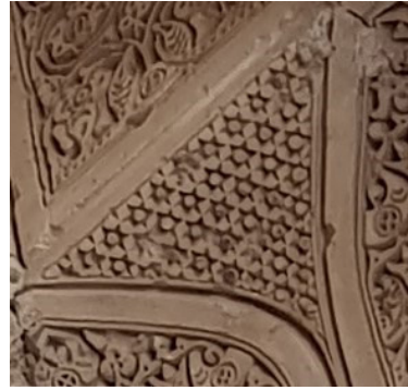
تصویر ۵: تزئینات هندسی مقرنس کاری زیر ایوان جنوبی، (چنگیز، ۱۴۰۱)

ستاره شش پر متشکل از دو مثلث که با چرخشی به صورت مخالف روی هم قرار گرفته‌اند ایجاد شده که تشکیل یک رأس را می‌دهد و این حالت اشاره به اولین مقام و اولین مرتبه سلوک دارد. از نظر برخی عرفا نیز چنین حالتی که دو عنصر مانند مثلث در یکدیگر تنیده شونده ایجاد تقارن می‌کنند که این امر نیز نشانه‌ای بر حالت ثبات و تمکین روحانیت دارد. شش پر بودن ستاره اشاراتی به آیین زرتشت در قبل اسلام نیز دارد که نشانی از شش امشاسپند بهمن، اردیبهشت، شهریور، سپندارمذ، خرداد و امرداد می‌باشد. عدد شش بیان‌گر نظم و تعادل است و اشاره دارد به روزهای هفته که یک روز آن، تعطیلی و شش روز دیگر مربوط به ایام کاری می‌باشد و ایجاد نظم در طول هفته می‌کند. همچنین در آیین دین اسلام، خداوند جهان هستی را در شش روز می‌آفریند که این عدد در این جا اشاره به یکی از مهم‌ترین امورات و اعمال خداوند دارد. دو مثلث که برهم منطبق‌اند یکی به‌سوی بالا است که نمود جهان ملکوتی و عالم والا را دارد و مثلث دیگر رو به‌سوی پایین و نمود جهان مادی و فانی را دارد که این مورد نیز اشاره به عالم کبیره است (حسینی، ۱۳۹۰: ۱۴). ستاره، مظهر وجودی حضرت حق در شب ایمان است تا مؤمنان را از پلیدی‌ها و موانعی که مانع رسیدن آنان به خداوند است، دور و خلاص کند. این ویژگی همواره برای بندگان اطمینان خاطر قلبی و آرامش روحی ایجاد می‌کند که این از وجود همان صفت راهنما و چراغ راه بودن می‌آید (حسینی و فراشی ابرقویی، ۱۳۹۳: ۳۵). همان‌طور که پیش‌تر بیان شد تحویل و تأویل تمام