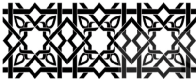
تصویر ۴: تزیینات هندسی گچ و آجرکاری جداره در ایوان شمالی، (علیزاده و مردی، ۱۳۸۶)