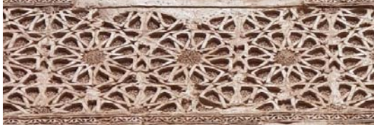
تصویر ۲: تزئینات هندسی گچی ایوان جنوبی، (چنگیز، ۱۴۰۱)

می‌باشد که در قسمت ایوان جنوبی و با استفاده از گچ و آجر