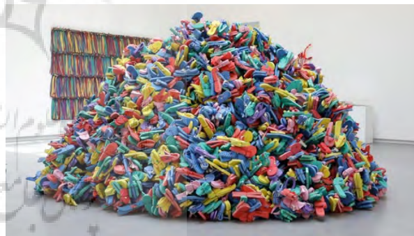
تصویر ۱- حسن شریف، هنرمند اماراتی، چیدمان دمپایی و سیم، ۲۰۰۹.

استفاده از هندسه اسلامی بر پایه سایه و نور یکی دیگر از ویژه‌گی‌های آثار این دوره است. در آثار چیدمانی می‌توان نقوش اسلامی را به حجم‌های نور و سایه تبدیل کرد بدون آن که جسمیت و شیئیت داشته باشند. این هم استراتژی برای گریز از قواعد سخت گیرانه در ساختن حجم و مجسمه است، و هم شیوه‌ای خلاقانه برای پدید آوردن غیر فیزیکی یک اثر است؛ مهم تر این که به آثار هنر اسلامی ابعاد فضایی و معمارانه می‌دهد. فضایی در بر گیرنده که همه را در خود می‌پذیرد. حتی وسیع تر از بناهای مذهبی که معذوریت حضور غیرمسلمانان دارد. مانند آثار رشاد الاکبروف، آنیل آقا، و نجات مکی. آثار الاکبروف (هنرمند آذربایجانی)، ترکیبی از فلز، چوب و شیشه است که وقتی نور از آنها می‌گذرد در زاویه‌ای معین، اشکال هندسی یا منظره می‌سازد. به همین شیوه با گذراندن نور از اشیائی در هم و بر هم، نقوش هندسه اسلامی را بر دیوار نقش می‌کند. از این آثار در جشنواره هنر اسلامی شارجه (۲۰۱۴) مورد توجه قرار گرفت (تصویر ۳). آنیل آقا (هنرمند پاکستانی آمریکایی) نیز در اثری با عنوان تقاطع (۲۰۱۴) فضای نور و سایه از نقوش اسلامی ساخت. این اثر با الهام از نقوش و معماری الحمرا طراحی شده که شامل مکعبی است که انتشار نور از درون آن، نقوش اسلامی را بر دیوار، کف و سقف و هر آنچه پیرامونش است منعکس می‌کند و همه چیز را در بر می‌گیرد. هنرمند در توصیف اثرش می‌گوید که درهای این فضای مقدس جدید به روی همه حتی غیرمسلمانان باز است و هم چون نور بر همه می‌تابد. نجات مکی (هنرمند اماراتی)، در اثری صوتی بصری کره‌ای از شیشه کریستالی آبی رنگ با نقوش اسلامی ساخت که نور ساعت شده از مرکز آن، نقوش را بر دیوار و فضای پیرامون منعکس می‌کرد و تصویری