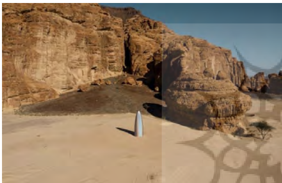
تصویر ۵- گزیلا کلون، هنرمند آمریکایی در دوسالانه هنر بیابان عربستان سعودی، ۲۰۱۹.

شد به مرکز تبادل فرهنگ‌ها تبدیل شده است. به عنوان مثال در سال ۲۰۱۲ این رویداد بر اندونزی متمرکز شد و از هنرمندان آسیای جنوب شرقی دعوت گرفت؛ در سال ۲۰۱۳ بر غرب آفریقا متمرکز شد و از هنرمندان نیجریه، سنگال، مالی و غنا دعوت گرفت. در سال ۲۰۱۴ بر منطقه قفقاز متمرکز شد و از هنرمندان قرقیزستان، قزاقستان، گرجستان، آذربایجان و روسیه دعوت گرفت. در سال ۲۰۱۵ بر هنر آمریکای لاتین و در سال ۲۰۱۶ بر فیلیپین متمرکز شد. به این ترتیب رویداد هنر دبی به چهار راه شمال و جنوب، و شرق و غرب تبدیل شد که نشانگر سیاست‌های تراملی و ترامنطقه‌ای امارات است (Sindelar, 2016, 8-9). در حال حاضر هنرمندان از بسیاری کشورها با دریافت کمک هزینه اقامت و سفر در رویدادهای هنری و فرهنگی امارات و قطر شرکت می‌کنند. این رویدادها هنرمندان لبنانی، پاکستانی، ایرانی، عراقی و سرزمین‌های غیراسلامی را به خود فراخواندند.