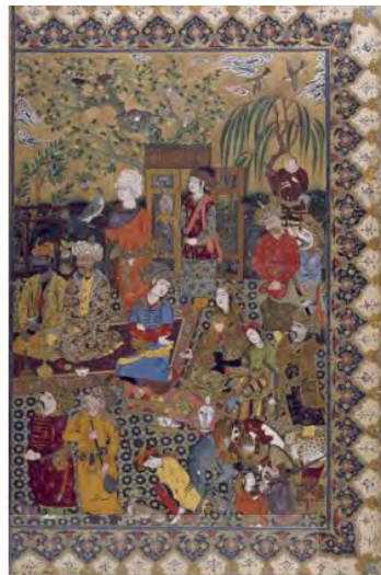
تصویر ۲- مجلس ضیافت شاه، نیمه راست نقاشی دو برگی (همراه بزرگ‌نمایی تصویر قرچغای خان)، ایران، حدود سال ۱۰۲۹ ه.ق/ ۱۶۲۰ م.، آبرنگ مات و طلا روی کاغذ.