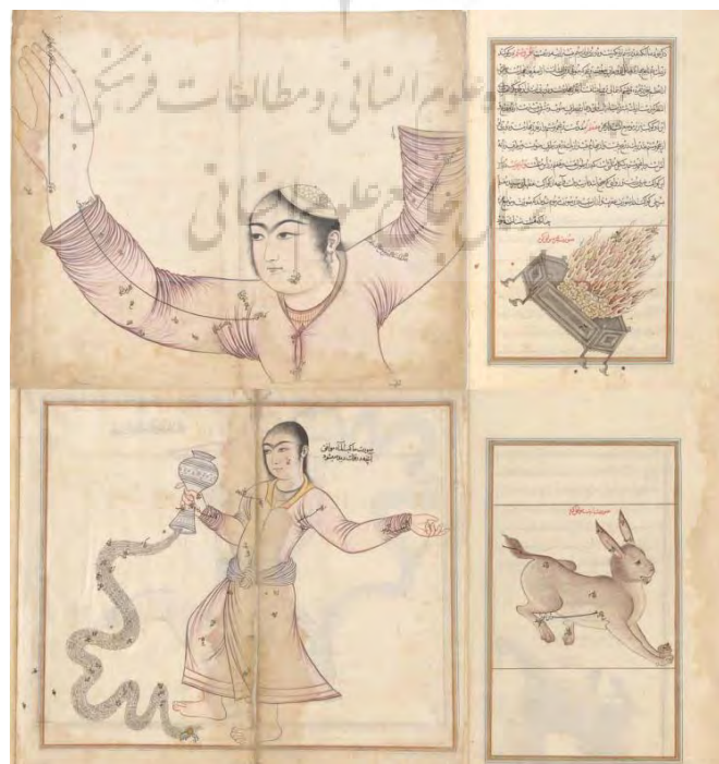
تصویر ۵- کادربندی نگاره ها، نسخه صورالکواکب منوچهر خان، مکتب مشهد، ۱۰۴۰-۱۴۰۲ ه. ق. / ۱۶۳۱-۱۶۳۳ م. مأخذ: (کتابخانه عمومی نیویورک، مجموعه اسپنسر)

در ادامه بررسی تصاویر این نسخه، به دو تصویر مضاعف بر صور فلکی موجود در دیگر نسخ برخوردیم؛ که اولین تصویر شتری است به صورت نشسته و دیگری طراحی کاملی از یک اسب ایستاده است. این دو اثر به ترتیب در انتهای مطالب صورهای فلکی شمالی و صورهای فلکی منطقه البروج رسم شده اند. با مشاهده نقطه هایی از کواکب که روی تصاویر ترسیم شده، گمان می رود در رصدهای مجددی که صورت گرفته، صورهای فلکی دیگری را مشاهده کرده اند که به دلایلی آن ها را تکمیل نموده اند؛ همچنین با نظر به اینکه در دیگر تصاویر از صور فلکی نام و نشان هر نقطه از ستاره ها در کنار آن مکتوب شده، و روی این دو تصویر اثری از نقاط نیست و البته اینکه درباره تصاویر در متن صحبتی نشده، می توان این تصاویر را تزئینی و صرفاً برای به رخ کشیدن مهارت نقاش تلقی کرد.