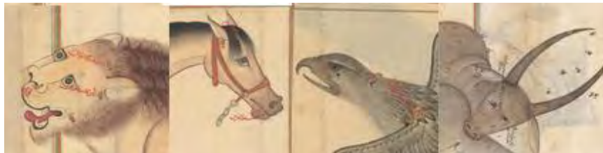
تصویر ۱۱- تصاویر حالت چهره‌ها و اجزای صورت در فیگورهای حیوانی، نسخه صورالکواکب منوچهرخان، مکتب مشهد، ۱۰۴۰-۱۰۴۲ ه.ق/۱۶۳۱-۱۶۳۳ م.