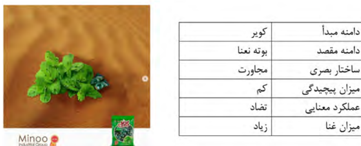
تصویر ۳- تبلیغ آب‌نبات نعنائی، مینو، ۱۳۹۹. مأخذ: ( https://www.instagram.com/p/CA0KzIvpeMr/ ); به همراه جدول تحلیلی استعاره بصری.