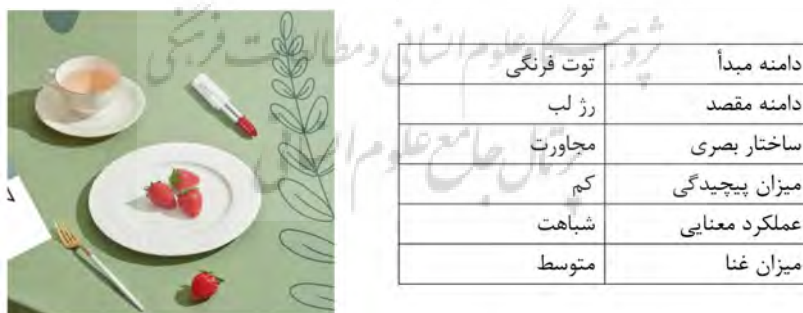
تصویر ۲- تبلیغ رژ لب، شوون، ۱۳۹۸. مأخذ: ( https://www.instagram.com/p/CIBeUh_HdSk/ ); به همراه جدول تحلیلی استعاره بصری.