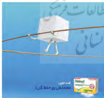
تصویر ۸- تبلیغ قرص کنترل قند خون، آژانس آدرس، ۱۳۹۹. مأخذ: ( https://www.instagram.com/p/B8HM5gcAu4H/ )، به همراه جدول تحلیلی استعاره بصری.

نتایج نوع‌شناسی ۲۴ تبلیغ اینستاگرامی که در جدول (۳) آمده است؛ نشان می‌دهد که «جایگزینی-ارتباط» با ۲۱ درصد بیشترین کاربرد را داشته و در مقابل «جایگزینی-تضاد» با ۴ درصد، کم‌ترین کاربرد را به خود اختصاص داده است. گونه «مجاورت-ارتباط» در مقام دوم کاربرد قرار داشته و ۱۷ درصد آثار را در بردارد. سایر گونه‌ها تقریباً کاربردی یکسان داشته و بین ۸ تا ۱۳ درصد مورد استفاده واقع شده‌اند. از طرف