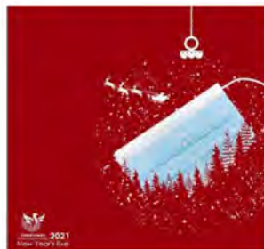
تصویر ۹- تبلیغ سال نو میلادی، کانون تبلیغاتی ملل رسانه، ۱۳۹۹. به همراه جدول تحلیلی استعاره بصری.

نقش استعاری رنگ‌ها: رنگ زرد هویت سازمانی برند ایرانسل است و رنگ طلایی نماد موفقیت، قدرت مردانه، و ثروت می‌باشد.