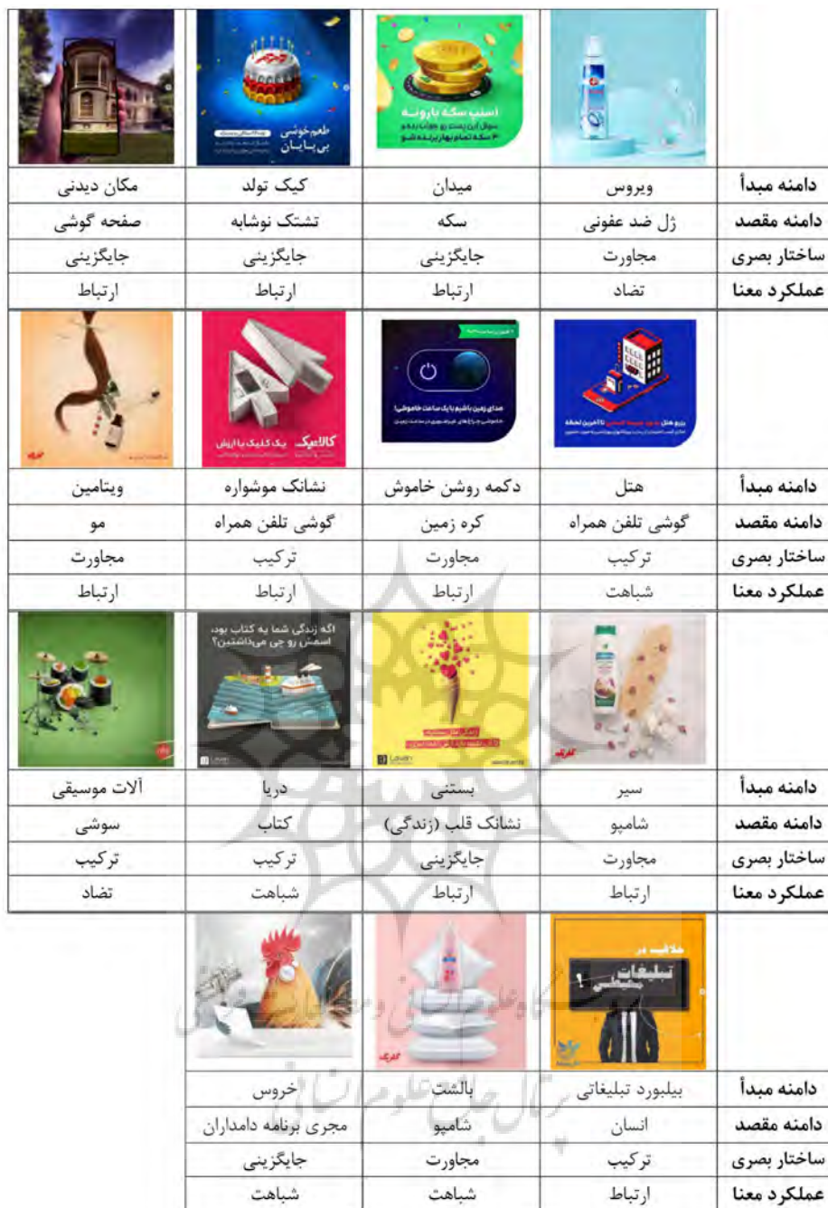
جدول ۲- نمونه آماری.

می‌گزیند. «بیسکویت»، دامنه مقصد و نیز محصول مورد نظر بوده و دامنه مبدأ، «گوشی پزشکی» می‌باشد. طراح از الکتروکاردیوگراف (نوار قلب)، بسته دارو و گیاه نیز به‌عنوان عناصر محیطی استفاده کرده و بدین ترتیب بر مفهوم سلامتی و زندگی تأکید دارد تا در یافتن استعاره به مخاطب کمک نماید. بعلاوه با افزودن بیسکویت در میان قلب، محصول مورد نظر را در کانون توجه قرار داده است. با توجه به حضور مستقل هر دو عنصر بصری در تصویر، دریافت آن برای مخاطب به سادگی امکان‌پذیر و از پیچیدگی کمی برخوردار است.