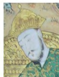
تصویر ۷- چهره‌های مشابه در یک نگاره شاهنامه بایسنقری میانه‌های قرن ۹ هجری.