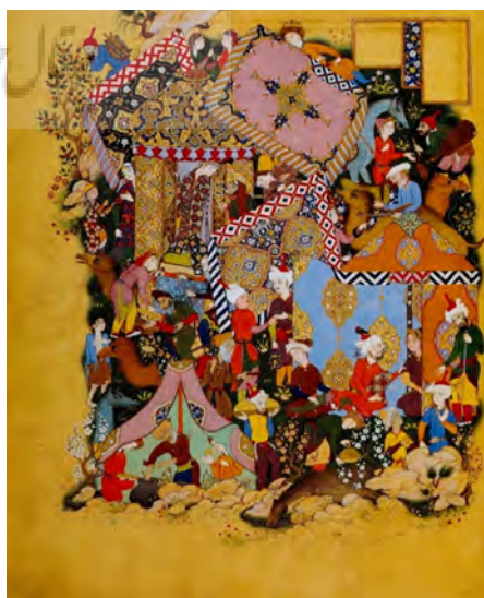
تصویر ۳- نزدیک شدن مجنون به خیمه‌گاه لیلی، هفت‌اورنگ جامی، نیمه دوم قرن ۱۰ ه.ق.