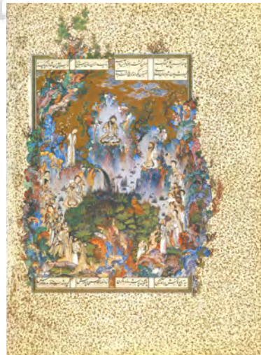
تصویر ۱- بارگاه کیومرث. اثر محمد سلطان، حدود ۹۳۱ ه.ق.

درواقع اقتصاد هنر آن دوران نیز اساساً بازنمودی از این شرایط بود. به‌طورکلی نقاشان نمی‌توانستند آزادانه کار کنند، چون نه بازار هنر پویا و پرقدرتی وجود داشت و نه حامیان متنوع. غالب آثار نقاشی باقیمانده از