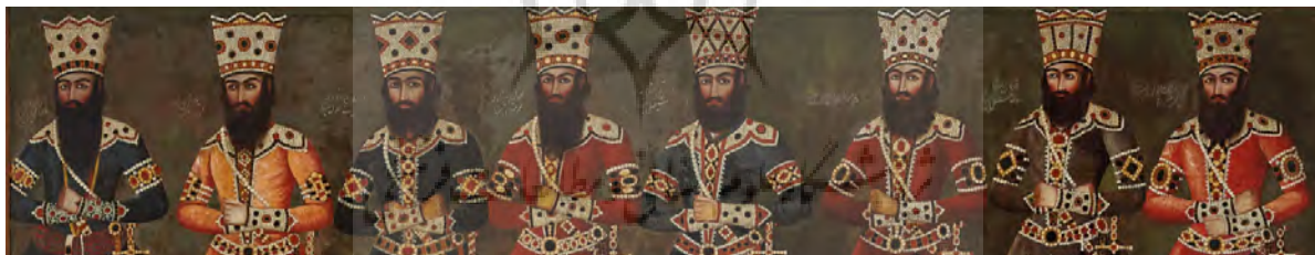
تصویر ۸- بخشی از تابلوی «صف سلام» منسوب به عبدالله خان نقاش‌باشی. دوره قاجار.

این تصویر نگاره‌ای تک‌برگ است با ابعادی کوچک و حاشیه بسیار ساده. همین شمای کلی به سرعت آن را از سنت پر جزئیات و فاخر درباری جدا می‌کند. در این نقاشی زن و مردی با خطوط موج و تند و کند قلم‌مو کشیده شده است. زن قدی کوتاه‌تر دارد و در حالی که در آغوش مرد جای گرفته با چشمانی مشتاق و با لبخندی محو به مرد می‌نگرد، مرد