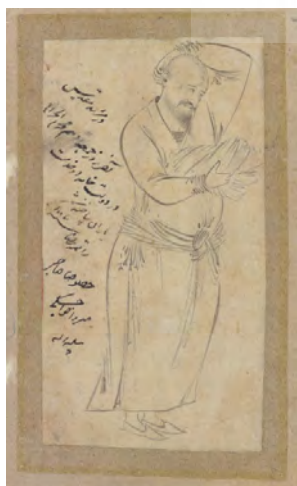
تصویر ۱۰- «زائر مشهد»، منسوب به رضا عباسی، ۱۰۰۶ ه.ق.