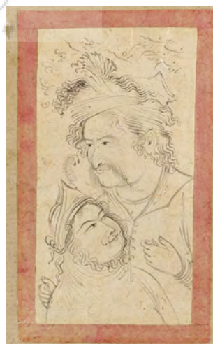
تصویر ۹- «دو دل‌داده» رقم معین مصور، ۱۰۵۲ ق. محفوظ در گالری فریبر.