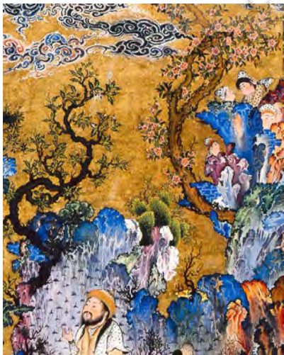
تصویر ۲- بزرگ‌نمایی بخشی از اثر «بارگاه کیومرث».

تخمین نظری از زمان متوسط برای اجرای هر نگاره در این دوران بسیار جالب‌توجه است. به نظر وی هر استاد برای ساختن یک مجلس کمتر از نیم‌سال وقت صرف نمی‌کرد. در اینجا باید در نظر گرفت که یک استادکار تنها ترکیب‌بندی کلی، انتخاب رنگ، ترسیم تصویر و کشیدن بخش‌های پیچیده نگاره را انجام می‌داد و کارهای ساده‌تر از قبیل رنگ‌آمیزی را به شاگردان واگذار می‌کرد (نظری، ۱۳۹۰، ۹۸). همچنین برخی شواهد و قرائن از وجود الگوهایی ثابت برای ترسیم در نقاشی ایرانی خبر می‌دهد. نگاره‌های بسیاری در سنت نگارگری ایرانی وجود دارد که در آن‌ها شخصیت‌هایی به شکل کاملاً یکسان ترسیم شده‌اند و یا حتی قطعاتی عیناً تکرار شده است (همان، ۹۷). این نگاره‌ها غالباً به‌صورت «جمعی» اجرا می‌شدند ولی باوجود این بازهم تولید یک نگاره چنین وقت‌گیر بوده است. افزایش طول مدت اجرای کار به معنای افزایش ریزه‌کاری و افزایش خرده‌صحنه‌ها در یک اثر است که این امر قاعدتاً باعث افزایش ارزش آن می‌شد. این بدان معنی است که مدت یا زمان کار (به‌عنوان عاملی اصالتاً کمی و مکانیکی) به‌صورت مستقیم نقشی اساسی در ارزش‌گذاری اثر داشته است.