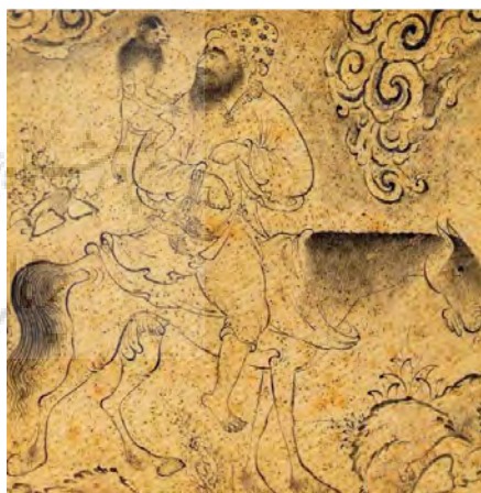
تصویر ۵- معرکه‌گیر، منسوب به رضا عباسی، قرن ۱۱ هجری. مأخذ: (کنبی، ۱۳۹۳، ۸۲)

تصویر (۶) اثری از «معین مصور» است که در آن «رضا عباسی» در حال کشیدن پرتزهای فرنگی است. معین مصور یکی از چهره‌نگاران معروف زمانه خود، از نقاشان کارگاه‌های درباری محسوب نمی‌شد. این اثر در سال ۱۰۴۴ «آبرنگ گردیده بود»، اما چهل سال بعد معین مصور آن را تکمیل می‌کند و شرح این تکمیل را با مدح رضا عباسی در حاشیه تصویر می‌نگارد. این تصویر و تصاویری از این دست در آن روزگار را می‌توان نشانه‌های دانست از گسترش روزافزون اهمیت «نقاش» و «نقاشی کردن». به شکلی که