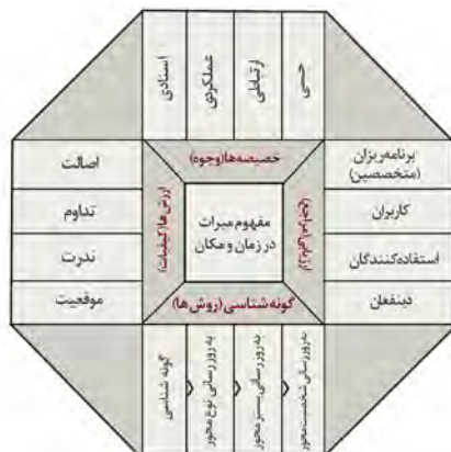
تصویر ۱- چهارچوب مفهومی ارزیابی ارزش‌های میراث فرهنگی.

در هر گونه از تمرین‌های ارزیابی ارزش‌های میراث، یکی از مراحل کلیدی که باید توسط محققان مورد توجه قرار گیرد، تدوین یک گونه‌شناسی از ارزش‌های مکان می‌باشد که در کمتر سندی مرتبط با دستورالعمل‌های ارزیابی ارزش به آن اشاره نشده است. به طور مثال دلاتوره و همکاران در سال ۲۰۰۲ م. در سند ارزیابی ارزش ارائه شده توسط موسسه‌ی گتی، گونه‌شناسی ارزش را در مراحل اولیه‌ی ارزیابی ارزش و در مرحله شناسایی قرار داده و این مهم را با توسل به مشورت با ذینفعان متنوع در هر نمونه‌ی مورد مطالعه قابل تحقق می‌دانند (De la Torre ed, 2002, 9). همچنین ولداپوس و رودرز در پژوهش خود با عنوان «یادگیری از یک میراث: ونیز تا والتا» تدوین گونه‌شناسی جامع، از ارزش را در گام دوم مدیریت مکان‌های میراثی و در پاسخ به سوال «چرا میراث برای ما ارزشمند است» جایگذاری می‌کنند (Veldpaus and Roders, 2014, 257). همچنین در پژوهش مشهور فردهایم و همکاران نیز، نویسندگان بیان می‌کنند که گونه‌شناسی ارزش اغلب در مرحله‌ی دوم این فرایند و در پاسخ به چرایی ارزشمندی خصیصه‌های مکشوف در مکان میراثی به کار گرفته می‌شود و به بیانیه‌ی اهمیت ختم می‌شود (Fredheim and Khalaf, 2016, 7). با این حال تعیین یک گونه‌شناسی تنها بخشی از فرایند ارزیابی ارزش مکان‌های میراثی به شمار می‌آید. این عمل بستری را برای تدوین بیانیه‌ی اهمیت به‌عنوان