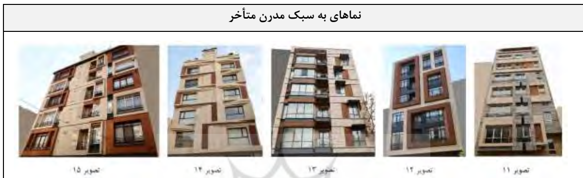
جدول ۷- مراتب توافقی و اختلاف نظر معماران و غیرمعماران در ارزیابی عناصر نماهای به سبک مدرن متأخر.