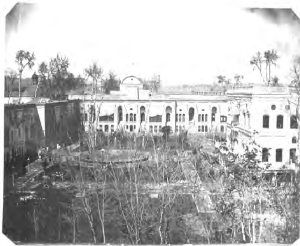
تصویر ۱- زیر نویس عکس: "عمارت حرم خانه طهران"، عکاس: حسینیعلی. مأخذ: (سمسار، ۱۳۸۲، ۲۵۰)

اعتماد السلطنه در خاطرات خود در تاریخ ۲۹ ذی الحجه ۱۲۹۹ هـ ق نوشته است: "عمارت اندرونی شاه تمام نشده. حرم خانه در آبدارخانه و صندوقخانه و عکاسخانه متفرق منزل کرده‌اند" (اعتماد السلطنه، ۱۳۷۹، ۲۰۲). در سال ۱۳۰۳ هـ ق ناصرالدین شاه مصمم گردید که برای خوابگاه خود نیز کاخی به سبک جدید در وسط باغچه اندرون بسازد (تصویر ۲). مباشرت ساختن این کاخ نیز به محمد ابراهیم خان امین السلطان واگذار گردید. بنای خوابگاه به سبک اروپایی ساخته و در نهم رجب ۱۳۰۴ هـ ق طی مراسم خاصی افتتاح گردید (ذکاء، ۱۳۴۹، ۲۵۴ تا ۲۴۲).