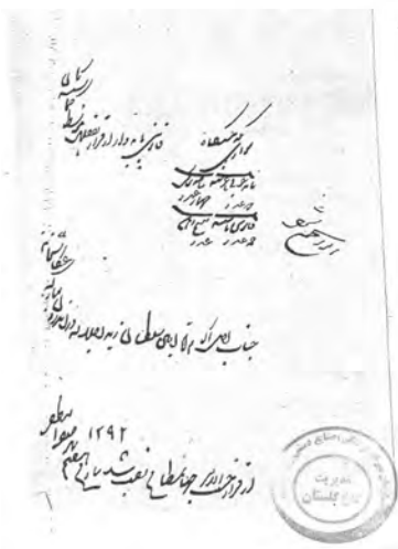
سند ۶ - صورت اسناد خریداری شده برای عکاسخانه جدید اندرون.

از قرار حسب الامر جهانمطاع [جهان مطاع] نصب شد تاریخ هفتم شهر صفر المظفر ۱۲۹۲ " ۱۶ (تصویر شماره ۶)