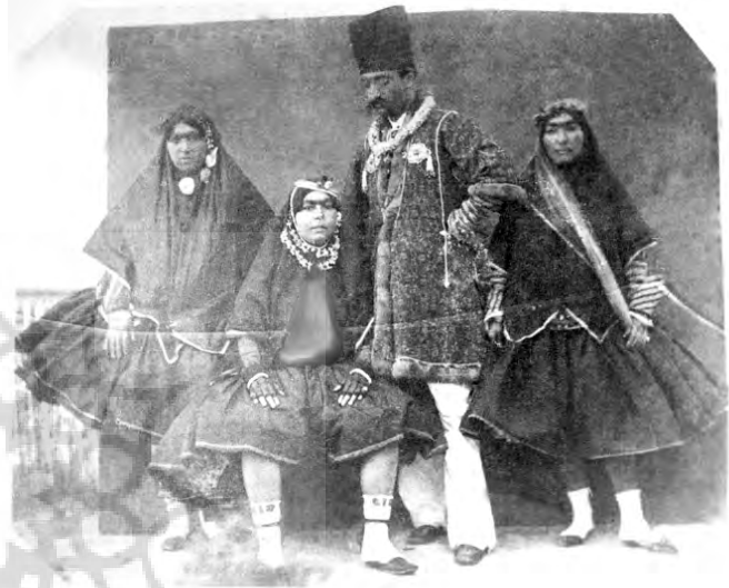
عکس باقری در قفسه نگارخانه

گرچه عکاسی از بانوان امری ناپسند و خلاف شرع محسوب می‌شد اما با سیاست‌های شاه در استفاده از محارم و خواجگان نوجوان، اختصاص دو مکان به عکاسخانه در فضای اندرونی و مدیریت آنها توسط یکی از بانوان تراز اول دربار نشان می‌دهد که عکاسی هنر نوظهوری که در ابتدا در دربار ناصری هنری مردانه تلقی می‌شد از طرف بانوان دربار به سرعت پذیرفته شده و احتمالاً خود گهگاه به این هنر مردانه نیز می‌پرداخته‌اند (تصویر ۷).