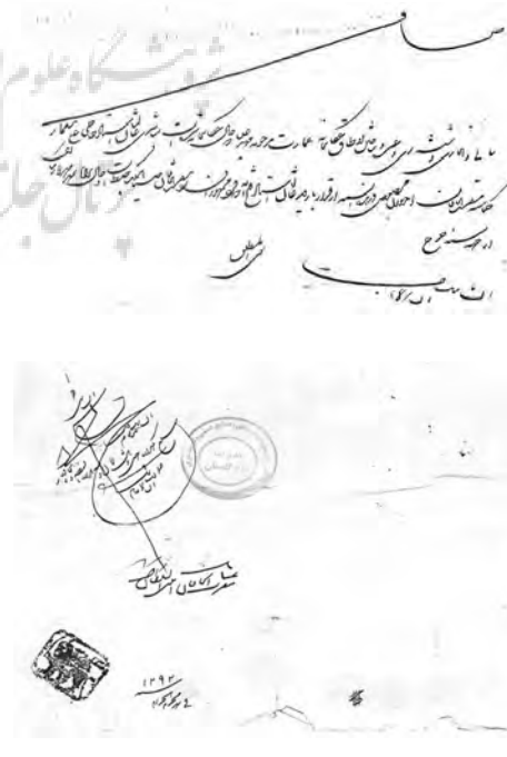
تصویر ۵ - سند تبدیل یکی از اتاق های عمارت مرحومه مهد علیا به عکاسخانه.

سوای المطلق ایت ائیل مبلغ یکهزار و چهل و هشت تومان و سه هزار و سیصد و پنجاه دینار مقرب الخاقان امین السلطان ۴ شهر محرم الحرام سنه ۱۲۹۲ " ۱۴ (تصویر شماره ۵)