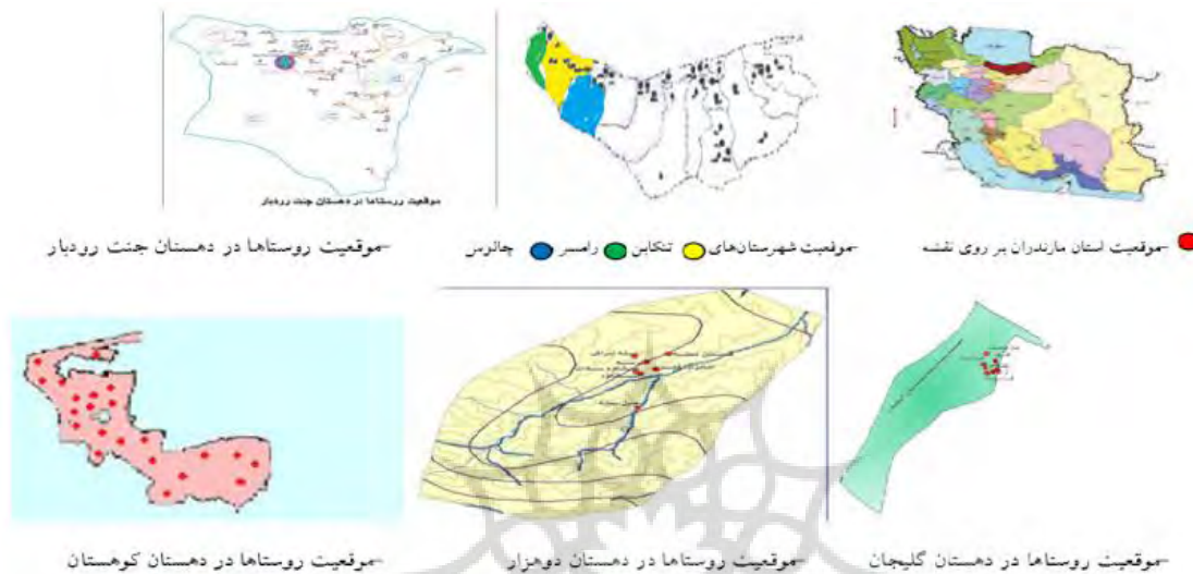
شکل ۱ موقعیت استان مازندران، شهرستان‌ها، دهستان‌ها و روستاهای آن جهت انجام پژوهش

جهت تکمیل پرسشنامه و گردآوری داده‌ها مشارکت نمودند. پس از تکمیل پرسشنامه‌ها، عملیات کدگذاری، استخراج داده‌ها و انتقال آن‌ها به رایانه انجام و پس از طی فرآیند داده‌پردازی، محاسبات آماری از طریق برنامه‌ی SPSSwin22 با استفاده از آماره‌های میانگین، انحراف معیار، آزمون فریدمن