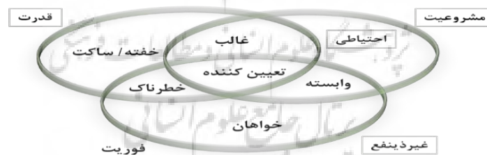
شکل ۱ نوع شناسی ذینفعان (منبع: اورگاز آگورا ، ۲۰۱۳)

❖ طبقه‌ی سوم: ذینفعان قطعی یا تعیین کننده هستند، که دارای هر سه ویژگی هستند و با به دست آوردن ویژگی از دست رفته خود را به مدیران معرفی کرده و در برابر حقوق خود مطالبه‌گر هستند (اورگاز آگورا ۳ ، ۲۰۱۳).