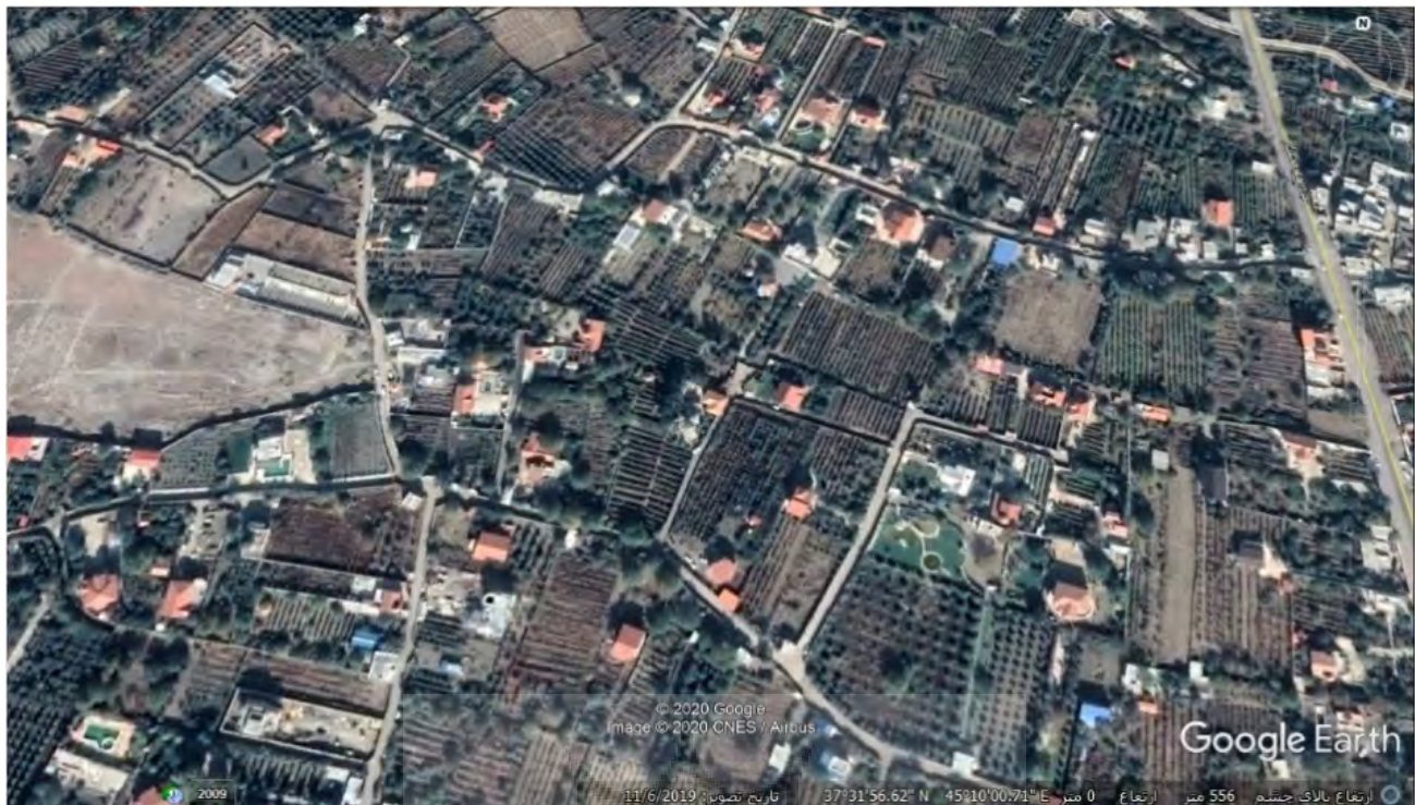
شکل ۲: تصور هوایی از باغ ویلاهای اطراف روستای امامزاده

باغ ویلا و کاه‌رستوران‌های باغی طرد معنایی کارکردی دارند.