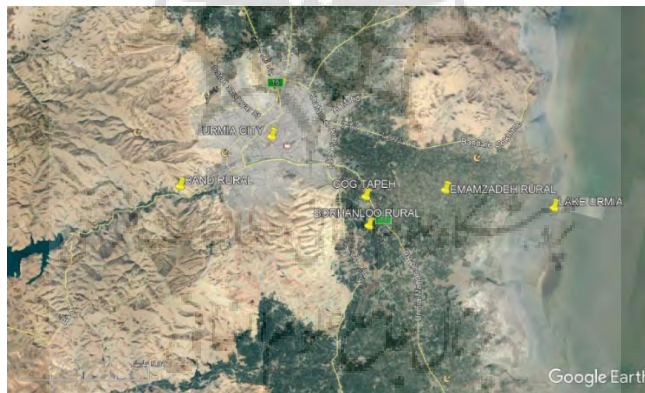
شکل ۱: مکان روستاهای مورد مطالعه

ما چهار روستای مقصد گردشگری در اطراف شهر ارومیه شامل بند، گوگ تپه، برهانلو و امام زاده را مورد مطالعه قرار دادیم. بر اساس سرشماری ۱۳۹۵ در این روستاها به ترتیب ۴۷۶۹، ۲۸۵۰، ۴۳۳ و ۴۷۲ سکونت داشتند.