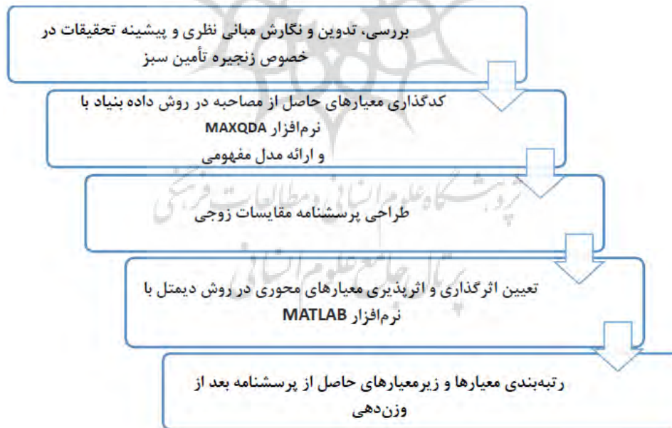
شکل (۲): مراحل اجرایی تحقیق

مصاحبه با روش کیفی داده بنیاد انجام گرفت. در فاز دوم، از روش کمی تصمیم‌گیری دیمتل و با استفاده از طراحان توزیع پرسشنامه مقایسات زوجی میان گروه خبرگان استفاده گردید. روش دیمتل این توانایی را دارد که شدت تعاملات و روابط میان عوامل را نشان داده و میزان اثرگذاری و اثرپذیری عوامل از یکدیگر را نشان دهد. تحقیق حاضر از نظر هدف کاربردی است. به منظور پوشش ابعاد مختلف موضوع پژوهش لازم بود با طیفی از تخصص‌های مختلف در طول زنجیره تأمین صنعت پتروشیمی، مصاحبه انجام گیرد. در این پژوهش، مصاحبه‌های نهایی با دوازده نفر از مدیران ارشد صنعت گردشگری استان فارس انجام شد. بعد از جمع‌آوری مصاحبه‌ها، تمام مراحل کدگذاری‌های معیارهای مرتبط با زنجیره تأمین سبز، با نرم افزار MaxQda انجام گرفته است. در نهایت بعد از طراحی مدل مفهومی پژوهش با روش داده‌بنیاد، برای اولویت‌بندی معیارها و زیرمعیارهای محوری با روش دیمتل به کمک طراحی پرسشنامه مقایسات زوجی به تعداد ۱۰ نفر از خبرگان این صنعت، به کمک نرم افزار MATLAB انجام شده است. جهت تجزیه و تحلیل مدل، مراحل زیر پیموده خواهد شد: