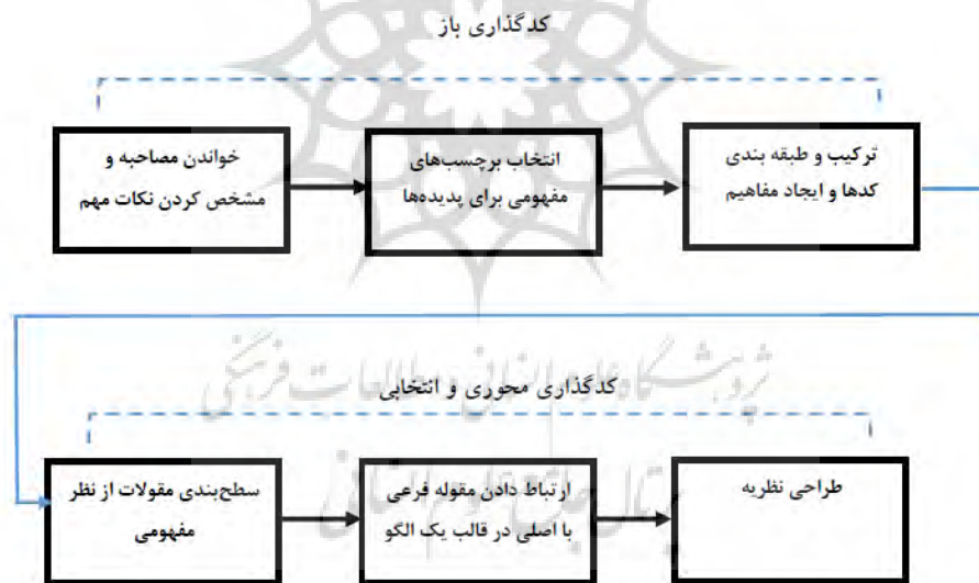
شکل (۳): فرآیند انجام کدگذاری‌های نظریه داده‌بنیاد (رضایی، ۱۳۹۶)

وقتی برای تبیین فرآیندی نیازمند نظریه باشیم، تحقق این امر مستلزم استفاده از راهبردی است که متضمن ساخت نظریه باشد. به دلیل آن که این پژوهش به دنبال چارچوب ساختاریافته برای نظریه آینده‌نگاری فرآیندی پیرامون مدیریت زنجیره تأمین سبز است، ابتدا از رویکرد کیفی داده‌بنیاد استفاده گردید. روش نظریه‌پردازی داده‌بنیاد بر استفاده از مراحل تحلیل داده‌ها از طریق کدگذاری باز، کدگذاری محوری و کدگذاری انتخابی تأکید دارد. در مرحله دوم با استفاده از روش دیمتل، اثرگذاری و اثرپذیری معیارها و زیرمعیارها مشخص گردید و در نهایت براساس وزن‌دهی به معیارها، اولویت‌بندی گردید.