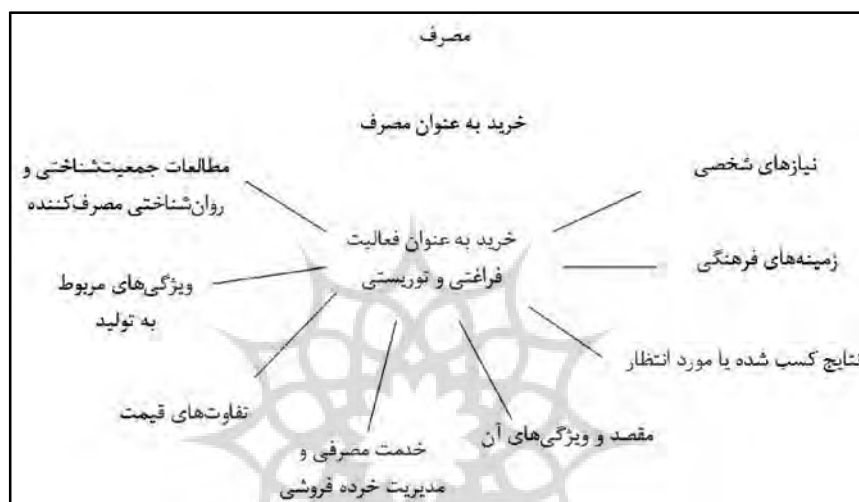
شکل (۱): عناصر خرید گردشگری، منبع: تیموئی (۲۰۰۵) اقتباس از مشکینی و همکاران، ۱۳۹۲

مطالعه نشان می‌دهد در فرایند خرید سوغاتی، عوامل مختلفی بر تصمیم‌گیری و رفتار خرید گردشگران نقش دارند. پژوهشگران در مطالعات‌شان در خصوص رفتار خرید گردشگر، به عوامل تأثیرگذار مختلفی اشاره کرده‌اند. تیموئی (۲۰۰۵)، در خصوص رفتار خرید گردشگر، به مجموعه‌ای از متغیرهای اصلی و فرعی اشاره کرده است (شکل ۱). متغیرهای اصلی عبارتند از: ویژگی‌های مردم شناختی و روانی خریدار (سن، جنس، رفتار)، نیازهای شخصی (افزایش شخصیت، اجتماعی شدن)، زمینه‌های فرهنگی (ملیت، سنت‌ها) و نتایج مورد انتظار (یافتن کالای اصیل). متغیرهای فرعی نیز عبارتند از: ویژگی‌های مراکز خرید (محیط فروشگاه)، مقصد و ویژگی‌های آن (مکان تاریخی، شهری)، مدیریت مراکز خرید (برآورده کردن نیاز بازدیدکنندگان خارجی)، قیمت (قیمت نسبی و ویژه) و ویژگی‌های مربوط به کالا (کیفیت، اصالت) (مشکینی و همکاران، ۱۳۹۲).