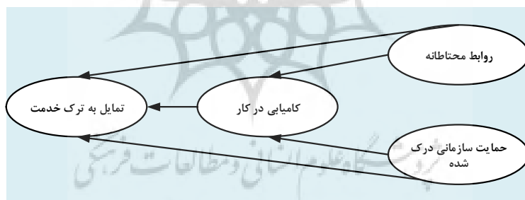
شکل (۱): مدل مفهومی پژوهش

بر اساس آنچه تاکنون گفته شد، مدل مفهومی پژوهش را می‌توان در قالب شکل ۱ نشان داد.