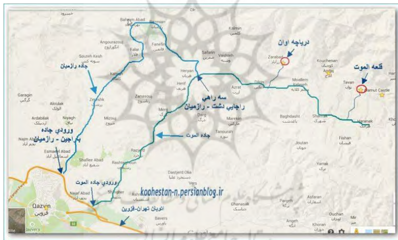
شکل (۲): مسیرهای ارتباطی منطقه مورد مطالعه

منطقه مورد مطالعه، بخش الموت شرقی بود که از نظر جغرافیایی در استان قزوین واقع شده است و بخش در حال رشد و منبع بسیار ارزشمندی برای بازار گردشگری روستایی و کشاورزی ایران به شمار می‌آید. عمده شهرت این بخش به علت وجود دریاچه اوان، دژ تاریخی الموت و درخت خونبار در آن است. به طور کلی منطقه الموت اقلیم متنوعی دارد، به گونه‌ای که هم دارای شالیزارهای برنج در مناطق حاشیه رودخانه شاهرود به ویژه در رازمیان است و هم باغات سردسیری گیلاس، فندق، گردو و غیره در آن جای گرفته‌اند. یکی از عمده‌ترین محصولات کشاورزی الموت، فندق است. استان قزوین پس از استان گیلان، رتبه دوم تولید این محصول را در کشور دارد و تقریباً تمامی تولید فندق استان قزوین در الموت انجام می‌شود. همان‌طور که قبلاً گفته شد، گیلاس تک‌دانه، گردو، زغال اخته و لوبیای مرغوب از دیگر محصولات کشاورزی متمایز الموت به شمار می‌رود. به طور کلی وجود جاذبه‌های گردشگری مختلف در الموت، زمینه مناسبی را برای ایجاد خوشه گردشگری و هم‌افزایی بین جاذبه‌ها فراهم کرده است.