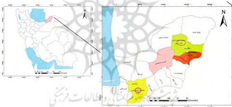
شکل (۲) نقشه منطقه مورد مطالعه

استان گلستان در قسمت شمالی کشور، بین عرض جغرافیایی ۳۶ درجه و ۳۰ دقیقه تا ۳۸ درجه و ۸ دقیقه شمالی و طول جغرافیایی ۵۳ درجه و ۵۷ دقیقه تا ۵۶ درجه و ۲۲ دقیقه شرقی از نصف النهار گرینویچ واقع شده است (شکل ۲) این استان دارای ۳۷ روستای هدف گردشگری است (سازمان میراث فرهنگی، صنایع دستی و گردشگری ایران، ۱۳۹۳) در این مطالعه روستای زیارت از شهرستان گرگان، روستای تنگراه از شهرستان گالیکش، روستاهای گچی‌سو بالا، گچی‌سو پایین و اوقچی از شهرستان کلالة بدلیل دارا بودن جاذبه‌های گردشگری متنوع از قبیل آبشارهای زیبا، چشمه آبگرم، امامزاده، بافت قدیمی روستا، وجود چشم‌انداز طبیعی، تولیدات کشاورزی، دامی و لبنی و صنایع دستی محلی که سالانه گردشگران زیادی را جذب می‌کنند، به عنوان روستاهای گردشگری انتخاب شدند. همچنین، ۵ روستای خوجه‌لر و صوفیان از شهرستان کلالة، روستاهای قانجق شهرک و آق‌قمیش از شهرستان گالیکش، روستای ایگدرسفلی از شهرستان گنبد به عنوان روستاهای غیرگردشگری انتخاب شدند.