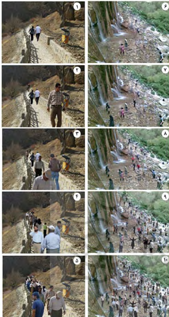
شکل ۱: تصاویر منطقه‌ی مورد مطالعه