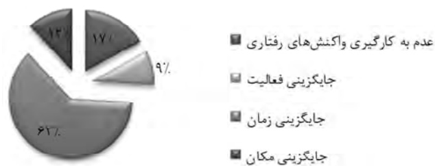
نمودار ۱: نمودار دایره‌ای فراوانی انواع واکنش‌های رفتاری