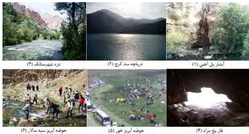
شکل (۲): ژئومورفوسایت‌های مورد مطالعه در منطقه