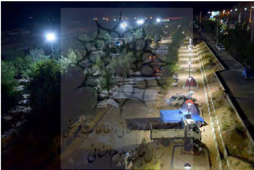
شکل شماره (۲): روشنایی بوستان

با توجه به حجم بالای عبور مسافران از شهر شاهرود ، برخی از آن ها شب ها را در بوستان های این شهر سپری می کنند. لذا روشنایی معابر و امکان عمومی نقش بسزایی در پیشگیری از جرائم شهر ایفا می نمایند.