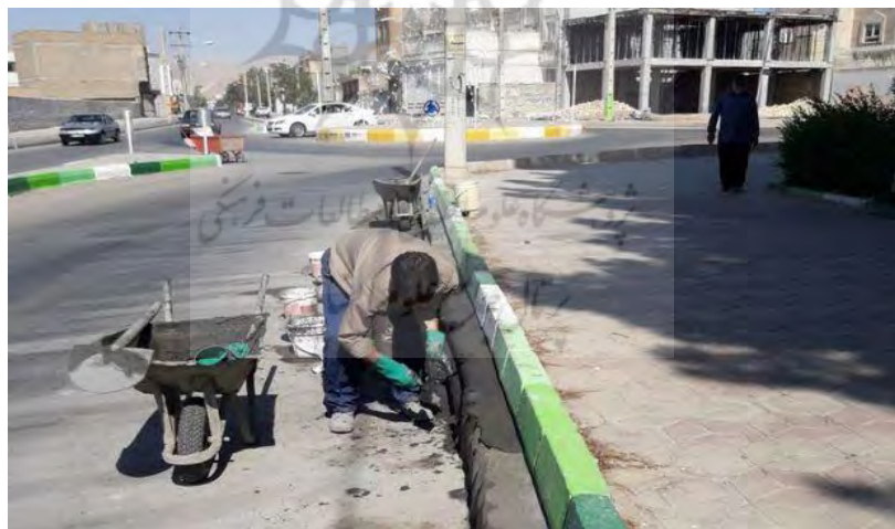
شکل شماره (۳): تصویر و نگهداری از فضا

می‌دهد که محیط فیزیکی کارکرد خود را به‌طور مؤثر انجام داده و موجب انتقال پیام‌های مثبت به تمام ساکنان و کاربران فضا خواهد شد. به‌طور قطع تحقیقاتی وجود دارد که نشان می‌دهد هر چه محیط و محله بهتر نگهداری شود علاوه بر اینکه قلمرو گرایی را میان ساکنان افزایش می‌دهد احساس تعلق به محله را ارتقا داده و این حس را القا خواهد کرد که محله دارای فضای امن است و کوچک‌ترین خطا و انحرافی در این محله با واکنش روبه‌رو خواهد شد. خانه‌ها و فضاهای خالی و بلا تصدی به مانند یک آهن‌ربا در برابر جرم عمل می‌کنند. این بخش از مفهوم نظریه CPTED با نظریه پنجره‌های شکسته رابطه‌ی تنگاتنگی دارد. یک پنجره تعمیر نشده و شکسته خود نشان‌های از این است که هیچ‌کس نگران نیست، بنابراین پنجره‌های بیشتر هیچ هزینه‌ای ندارد. بر اساس پژوهش‌های صورت گرفته توسط ایران فر (۱۳۹۳) نتایج حاکی از این مطلب بوده است که تصویر و نگهداری از فضاهای شهری و غیرمسکونی تأثیر بسزایی در کاهش سرقت داشته و نقش کلیدی در پیشگیری‌های جرم ایفا نموده است.