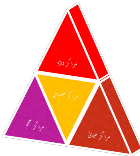
جدول ۱-۲- استراتژی انهدام مراکز ثقل (حلقه های واردن)