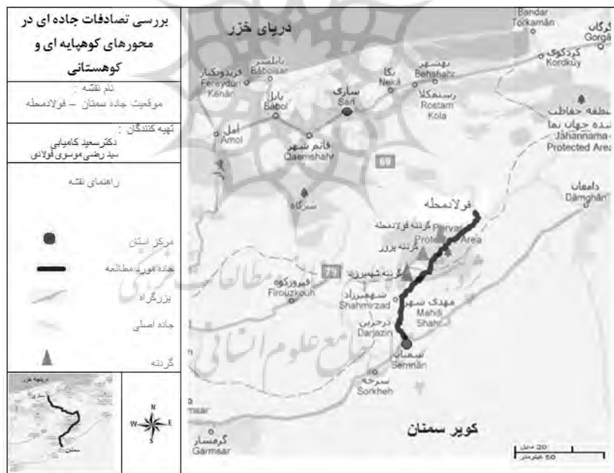
شکل شماره ۱: موقعیت جاده سمنان - فولادمحله

منطقه مورد مطالعه در این پژوهش جاده سمنان، فولادمحله، به طول ۹۰ کیلومتر است که از نظر طبقه‌بندی جاده ای در گروه راه های اصلی کشور قرار گرفته است. این محور یکی از مهمترین راه‌های مواصلاتی است که در امتداد مرکز دو استان سمنان و مازندران قرار گرفته است و جاده چشمه علی دامغان در محدوده فولاد محله از آن منشعب می شود (شکل ۱). این محور در طول مسیر از سمنان تا مهدیشهر دارای اقلیم گرم و خشک و در حدفاصل مهدیشهر تا فولادمحله از نواحی کوهستانی البرز و گردنه‌های مرتفع بشم شهمیرزاد (۲۴۴۰ متر)، پرور (۲۳۵۰ متر) و فولادمحله (۲۴۰۰ متر) عبور می کند و در طی فصول مختلف به ویژه زمستان تحت شعاع بارش و یخبندان می باشد.