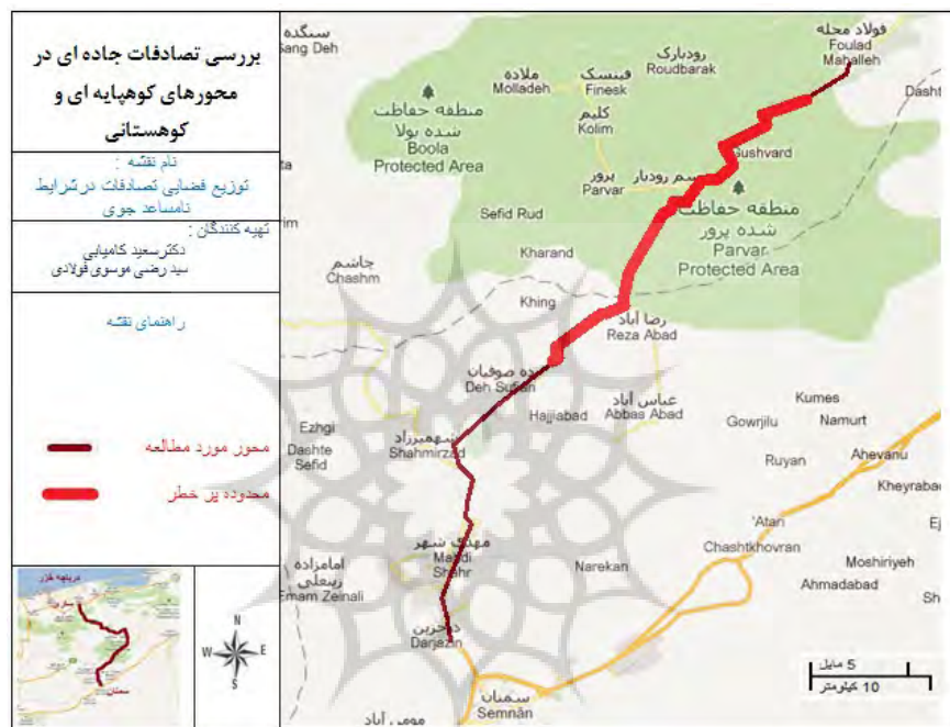
شکل شماره ۳: محدوده پرخطر در شرایط نامساعد جوی

که در برگیرنده گردنه‌های شه‌میرزاد، پرور و فولادمحله و همچنین دارای شیب وقوس جاده می‌باشد جزء نقاط پرخطر در فصول سرد سال محسوب می‌شود.