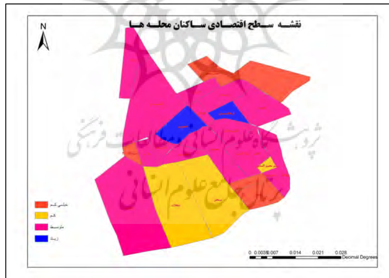
شکل ۲: نقشه سطح اقتصادی ساکنان محلات شهر سمنان