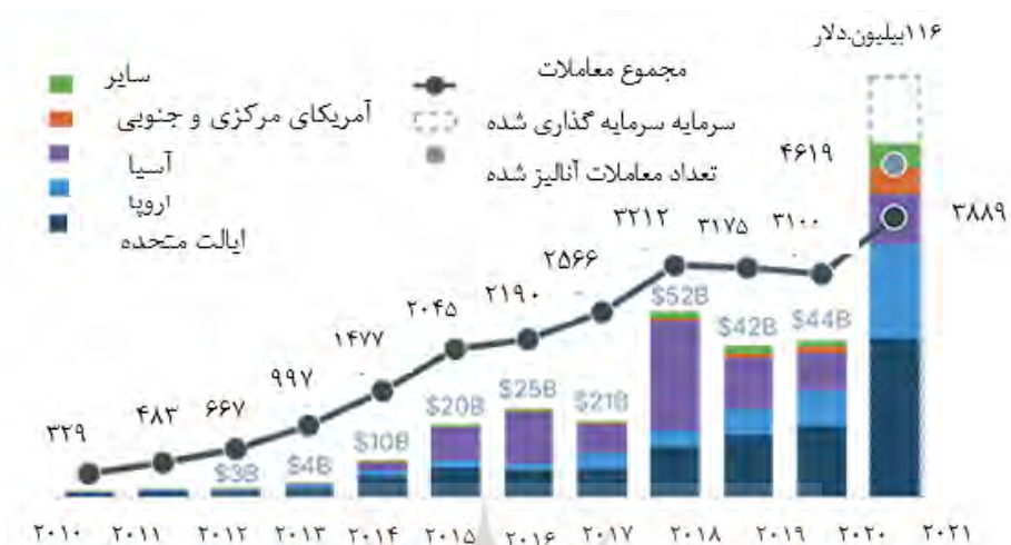
شکل ۲: سهم فین‌تک از فعالیت‌های سرمایه‌گذاری خطرپذیر منطقه‌ای

فین‌تک از بدو تولد در قرن ۱۹، تاکنون ۳ دوره کامل را طی نموده است و از نظر بسیاری از محققین، اقتصاد جهان در آغاز دوره چهارم فین‌تک است. نوع توجه و پرداخت‌های پژوهشی به پارامتر نوآوری، در هر ۳ دوره گذشته، به صورت پیوسته در حال تغییر بوده است. در هنگام ورود به هر دوره جدید، یک پرسش چالش برانگیز، با این عنوان وجود داشته است که «نوآوری چیست؟». با ورود به عصر چهارم فین‌تک، پاسخ به این پرسش ابهام برانگیزتر شده است؛ زیرا حجم نوآوری‌ها، بیش از حد توسط مشتریان و ناظران قابل بررسی می‌باشد و به همین دلیل، برخی از مدیران ترجیح داده‌اند با ایجاد مقرراتی پویا برای رشد نوآوری، فضایی با بار نظارتی کم‌تر، فراهم نمایند. بنابراین در عصر جدید فین‌تک، نوع واکنش مشتریان به هر نوآوری، حائز اهمیت می‌باشد (ستیاوان و ماولیساً، ۲۰۲۰).