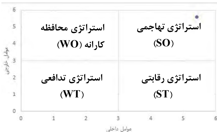
شکل ۳: ماتریس استراتژی‌ها و اولویت‌های اجرایی ماتریس SWOT در دانشگاه افسری امام علی (ع)