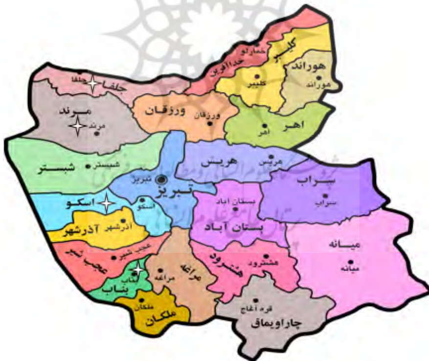
شکل ۱. موقعیت جغرافیایی روستاهای مورد مطالعه در استان آذربایجان شرقی

* تعداد جمعیت و خانوار بر اساس نتایج سرشماری عمومی سال ۱۳۹۵ ذکر شده است.