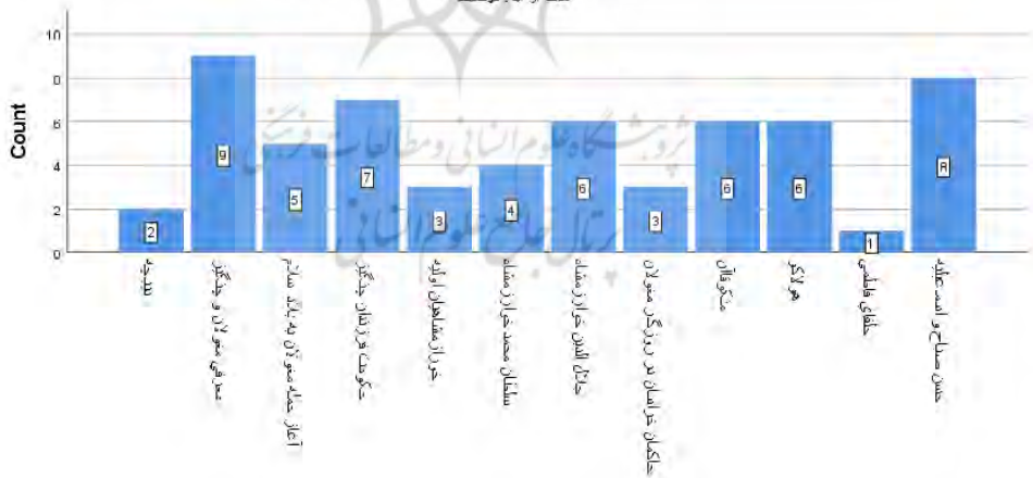
هدف از آیه: توصیف