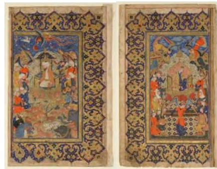
شکل ۳. بر تخت نشستن فردوسی، ۱۵۹۰-۱۶۰۰ م شکل ۴. بر تخت نشستن سلیمان، شاهنامه قوام، ۱۰۰۰ ق، هنرمند نامعلوم، موزه رضا عباسی