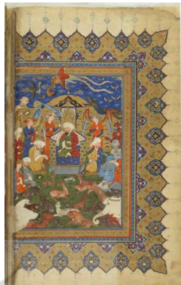
شکل ۵. بارگاه سلیمان نبی، شاهنامه فردوسی، کتابخانه ملی فرانسه، شعبه شرقی فارسی شماره ۴۹۰، ۱۰۱۲ ق