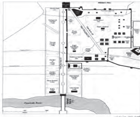
تصویر شماره ۱: جانمایی باغ وحش و باغ پرندگان در حاشیه زاینده رود اصفهان صفوی (بلیک ۱۳۸۱)

عباس در کنار رودخانه پی انداخت باغ پرندگان و همچنین باغ وحش بوده که در برخی از متون تاریخی بدان اشاره شده است: «پرند خانه شاهی در کناره‌های غربی رود و در کرانه‌های شرقی نیز شیرخانه سلطنتی قرار داشت که در آن خرس، پلنگ، گوره خر، کرگدن و شیر نگهداری می‌شد. باغ پرندگان شکاری نیز در آن سوی کرانه‌های شرقی رود قرار داشت» (همان، ص ۱۰۶). (تصویر شماره ۱)