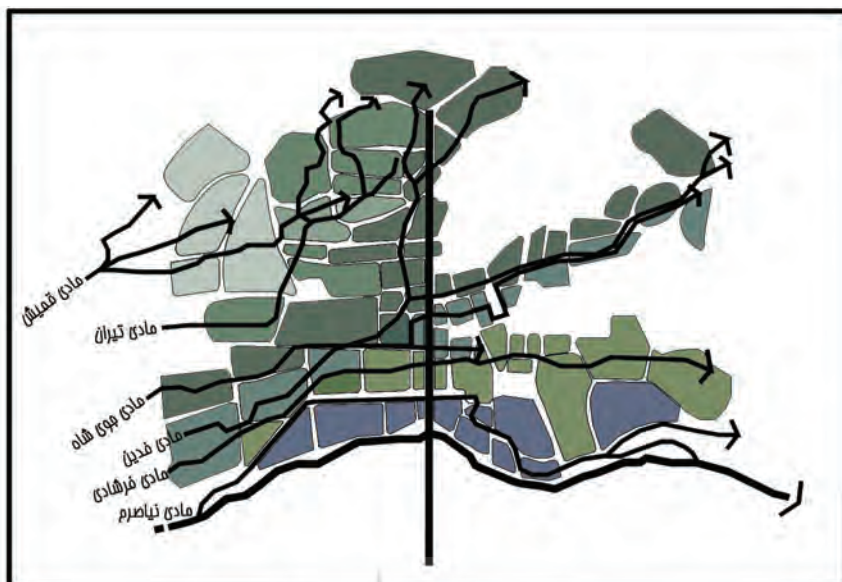
نقشه شماره ۲: عبور شبکه مادی ها از میان محلات در شمال شهر

که به آب داشتند پیرامون مادی ها شکل می گرفتند. به طور مثال چهارباغ صدر از یک طرف منتهی به مادی نیاصرم و از طرف دیگر به رودخانه منتهی می شد (اصفهانی ۱۳۳۸). مکانیابی عناصر شهری نیز در طرح توسعه شهر نیز مستلزم حضور آب بود و جانمایی دولتخانه صفوی از این امر مستثنی نبود به همین منظور این میدان در مکان باغ تاریخی نقش جهان که دو مادی فرشادی و فدین و شاخه ای از جوی شاه از شمال و جنوب آن عبور می کرد ساخته شد به طوریکه نامداریان و دیگران (۱۳۹۵) یکی از مؤلفه های تأثیر گذار در اندازه میدان را فاصله میان دو مادی عنوان کرده است.