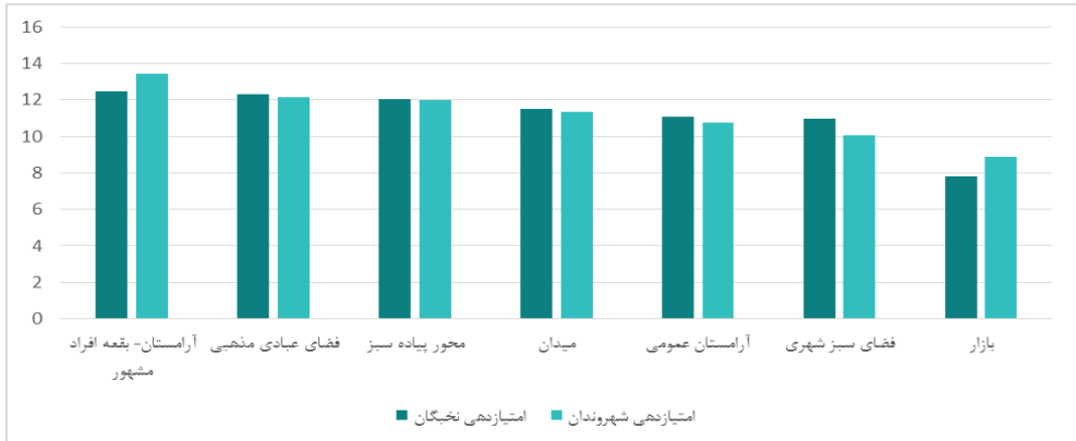
نمودار شماره (۲): مقایسه امتیاز انواع گونه‌های فضاهای شهری در برخورداری از حس معنویت بین گروه نخبگان و