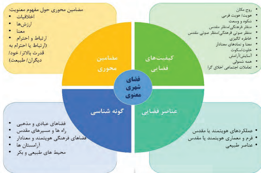
شکل شماره (۱): چارچوب نظری فضای شهری معنوی