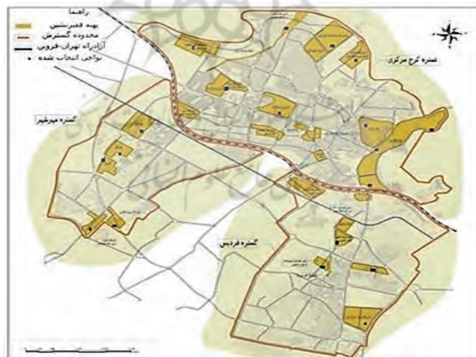
شکل شماره (۳): پهنه‌های فقیرنشین شهر کرج