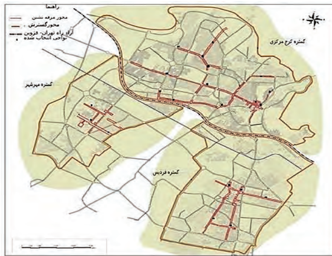
شکل شماره (۴): پهنه‌های مرفه‌نشین شهر کرج

در این کتاب نام کرج در ضمن ولایات عراق عجم از توابع طالقان آمده و نوشته شده است که در این ولایت ده‌های معتبر بوده است. ممکن است نام کرج و رودخانه کرج از واژه‌ی «گود» که در اوستا به‌عنوان یکی از شعبات رنگ‌هاست، گرفته شده باشد که پس از سال‌های دراز، اینک به‌صورت کرج درآمده است. درحالی‌که اگر از واژه‌ی کراج به معنی بانگ و فریاد گرفته شده باشد، در این صورت نیز با سابقه‌ی باستانی آن ارتباط پیدا می‌کند؛ زیرا در تپه‌ی آتشگاه و کوه‌های مرادتپه و کلاک و قلعه‌دختر شهرستانک در ایام باستان برای خیر رسانیدن و دیده‌بانی آتش‌افروزی می‌شد و بدین طریق هجوم دشمن را به یکدیگر خبر می‌دادند. به‌احتمال زیاد کرج مبدأ خبری بزرگی جهت رگا (ری) بوده و از آن‌رو ممکن است که در اصل کراج بوده باشد (سند توسعه راهبردی کرج، ۱۳۹۴).