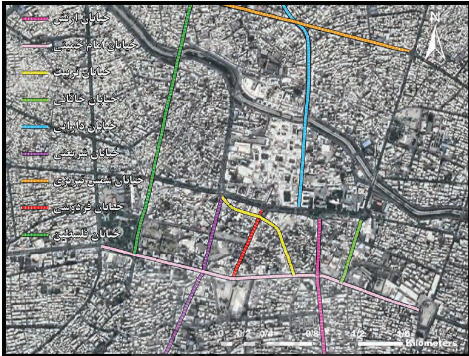
تصویر شماره (۱۰): موقعیت خیابان‌کشی‌ها در بافت شهری تبریز

بالایی است و حداکثر متراژ خانه‌ها اکثراً به ۵۰ متر هم نمی‌رسد. اکثر ساکنین، جهت انجام نیازهای روزمره از جمله خرید و رفتن به مدرسه، مجبور به بالا رفتن از ۲۰۰ الی ۳۰۰ پله‌ی غیراستاندارد و فاقد نرده حفاظتی هستند. تردد در چنین مسیری در فصول سرد و یخبندان، مخصوصاً برای کودکان و سالمندان بسیار خطرناک است. ساختار پله‌ای واحدهای مسکونی و کوچه‌های دراز و باریک محله ملازینال باعث شده است که ساکنان این محله در سال‌های گذشته از دسترسی به خدمات رفاهی عمومی از قبیل بوستان محله، خطوط اتوبوس‌رانی و مانند آن بی‌بهره باشند. مسیرگشایی ملازینال یکی از پروژه‌های مهم شهرداری منطقه ۱ تبریز در راستای احیای بافت فرسوده و بهبود دسترسی و توسعه امکانات مناطق کم برخوردار بوده