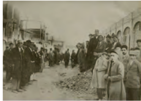
تصویر شماره (۱): احداث خیابان پهلوی (امام خمینی) تصویر شماره (۲): خیابان پهلوی (امام خمینی) دهه چهل خورشیدی

محوطه پیرامون ارگ علیشاه به باغ ملی و گردشگاه عمومی تبدیل شد. در مجاورت آن و در بخشی از زمین‌های محوطه ارگ در سال‌های بعد مراکز خدماتی و تفریحی مانند بیمارستان شیر و خورشید، سالن تئاتر، دبیرستان، کتابخانه و ... ساخته شدند (صفا منش و همکاران، ۱۳۷۶: ۴۵). خیابان امام خمینی از اولین خیابان‌های تبریز می‌باشد که در سال ۱۳۲۵ یعنی در زمان حکومت ملی آذربایجان آسفالت شد. در گذشته مردم تبریز به این خیابان قیرقوم یعنی آسفالت یا باش خیوان یعنی خیابان اصلی می‌گفتند.