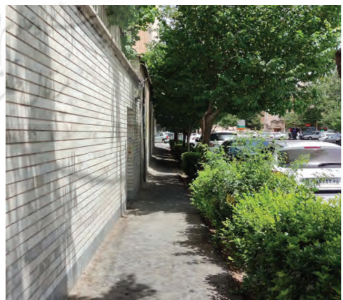
شماره (۱۷): قسمتی از پیاده‌روی خیابان ارک جدید