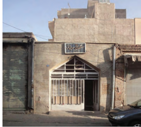
تصویر شماره (۱۹): بنای تاریخی سنگک پزی محله بارون آواک تبریز مربوط به دوره قاجار

یکی از راه‌حل‌های مدیریت شهری تبریز جهت تسهیل در حرکت وسایل نقلیه و بازآفرینی شهری محسوب می‌شود؛ اما اجرای بدون مطالعه و نیازسنجی این‌گونه پروژه‌ها همواره مسائل و چالش‌هایی را به همراه داشته که می‌بایست مورد آسیب‌شناسی قرار گیرند. از تبعات اجرای این‌گونه پروژه‌ها در بافت شهری تبریز می‌توان به بهبود دسترسی در محلات کم‌برخوردار و حاشیه‌نشین و توسعه امکانات بخش عمومی، نوسازی بافت فرسوده، تغییر در هندسه معنایی شهر، تضییع حقوق شهروندی، ضعف مطالعه و نیازسنجی و آسیب‌رسانی به بافت باارزش شهری اشاره نمود. برای هر یک از این تبعات، نمونه‌ای در شهر تبریز معرفی و مورد ارزیابی قرار گرفته است. نتایج حاصل از تحقیق نشان می‌دهد که آن دسته از خیابان‌هایی که بر اساس منطق رشد و حرکت شهر و بر اساس دستورالعمل‌های متناسب با ژنوم آن تعریف و تعریض شده‌اند، موفق‌تر از خیابان‌های تک‌بعدی و تحمیلی عمل کرده‌اند. در شهر تبریز تعریض خیابان‌ها و گذرهایی مثل تربیت، راسته کوچه و امام خمینی در تناسب با قواعد شهر، فضاهایی نسبتاً موفق و قابل قبول در شهر را موجب شده‌اند.