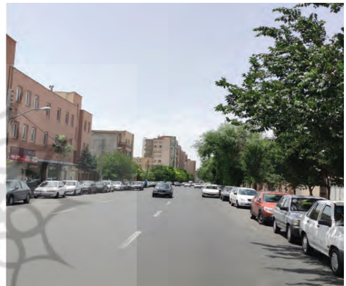
تصویر شماره (۱۶): نمایی از خیابان ارک جدید تصویر

بوده است. اختلاف ارتفاع در بخشی از مسیر پیاده عبور معلولین را تقریباً غیرممکن می‌سازد. حتی سرعت خودروهایی که در این خیابان همچون اتوبان‌ها می‌رانند و عبور از آن را برای عابران بخت برگشته به یک سفر ماجراجویانه تبدیل می‌کنند، قابل تأمل است. پیاده‌روهای باریک، عرض زیاد سواره و پارک حاشیه‌ای، رانندگان را تشویق می‌کند تا با تمام توان در این مسیر جولان دهند. در واقع خیابان ارک جدید این پیام را به عابرین منتقل می‌نماید که "این فضا برای شما احداث نشده است!"