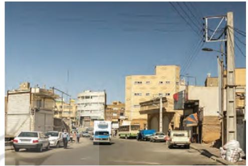
تصویر شماره (۱۱): مسیر گشایی ۱۶ متری ملازینال

است. این مسیر گشایی با هدف پاسخگویی به مطالبات به حق و طولانی شهروندان این منطقه اجرا شده است. پیش از اجرای پروژه، ورودی این خیابان سه متر بود. طرح مسیر گشایی ۱۶ متری ملازینال علاوه بر تسهیل دسترسی مردم این منطقه به کمربندی پاسداران، از نظر تغییر چهره شهر در این نقطه و احیای سکونتگاه‌های غیررسمی بسیار حائز اهمیت است.