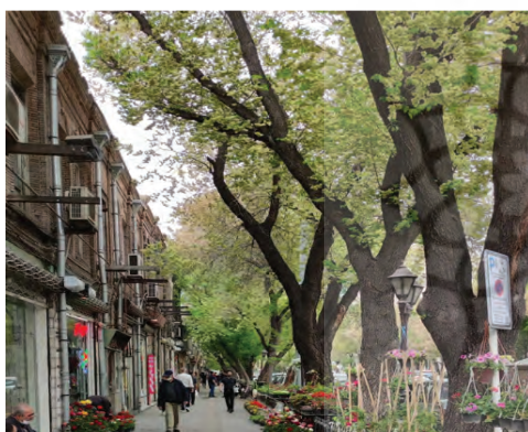
شماره (۱۵): قسمتی از پیاده‌روی خیابان امام خمینی