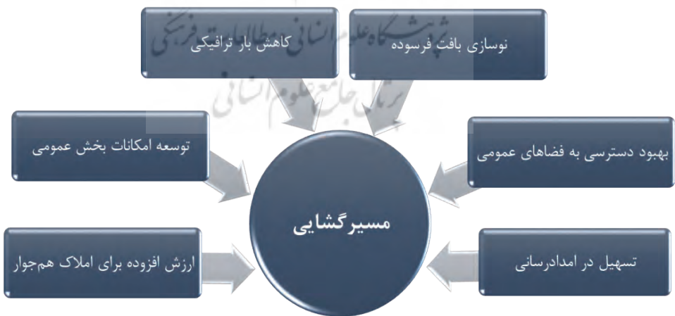
شکل شماره (۱): تبعات مثبت اجرای پروژه‌های مسیر‌گشایی در بافت شهری

امدادرسانی به آسیب‌دیدگان یکی از مهم‌ترین مراحل مدیریت بحران است که باید پیش از رخداد حادثه برای آن برنامه‌ریزی نمود. امدادرسانی به‌موقع و بهره‌ور خسارات جانی و مالی را به شدت کاهش خواهد داد (سیدی و همکاران، ۱۳۹۹)؛ بنابراین ایجاد مسیر جهت تردد و دسترسی سریع خودروهای امدادی و همچنین