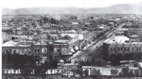
تصویر شماره (۵): خیابان فردوسی تبریز سال ۱۳۳۵ شمسی