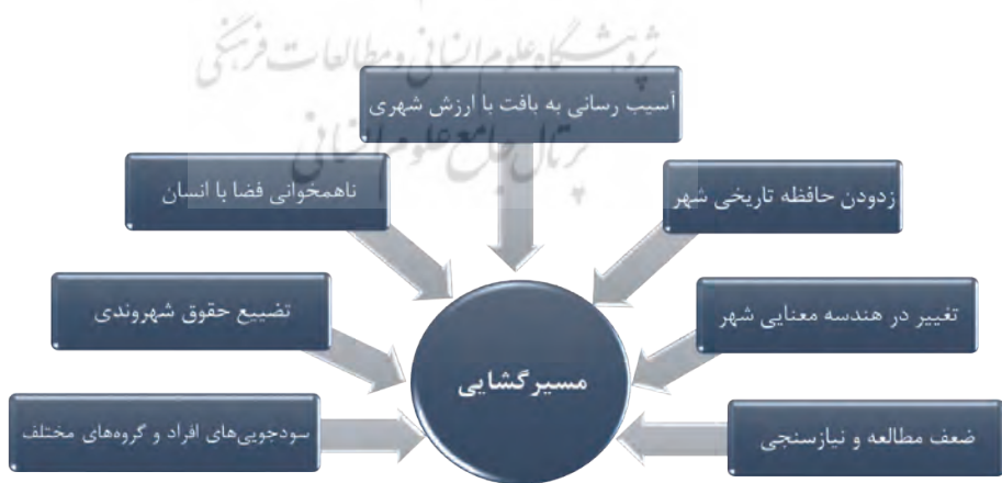
شکل شماره (۲): تبعات منفی اجرای پروژه‌های مسیرگشایی در بافت شهری

همچنین ایجاد ارزش‌افزوده در کاربری جداره‌ها، املاک و زمین‌های مجاور مسیرگشایی‌ها در بافت شهری همان‌طور که می‌تواند به‌عنوان یک فرصت مطرح شود، می‌تواند یک تهدید نیز باشد. لذا برنامه‌ریزی و اجرای این‌گونه پروژه‌ها ممکن است با هدف سودجویی‌های احتمالی افراد و گروه‌های مختلف صورت پذیرد. به‌عنوان مثال کسانی که با استفاده از رانت اطلاعاتی خود و قبل از آگاهی