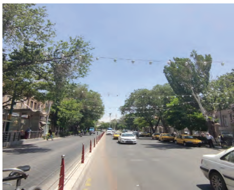
تصویر شماره (۱۴): نمایی از خیابان امام خمینی تصویر