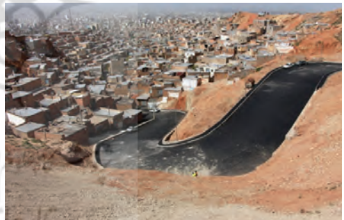
تصویر شماره (۱۲): رمپ خروجی ملازینال به کمربندی پاسداران