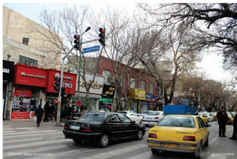
تصویر شماره (۷): قسمت‌هایی از خیابان شریعتی تبریز

میدان منجم متصل نمود. در همین زمان خیابان ملل متحد (فلسطین کنونی) نیز از میدان گوشه شمال شرقی باغ گلستان، به خیابان شمس تبریزی وصل گردید. دروازه گجیل که تا آن زمان پابرجا بود، با اینکه در لبه غربی خیابان ملل متحد و بیرون از حریم خیابان قرار می‌گرفت، در اثر بی‌توجهی مسئولان وقت شهرداری تخریب‌شده و از میان رفت. با ایجاد دو خیابان یاد شده، محدوده مرکزی و هسته تاریخی شهر در درون یک چهارضلعی قرار گرفت که مجموعه بازار، دقیقه در بخش مرکزی آن جای دارد.