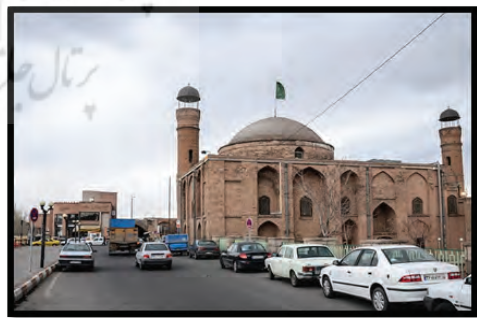
تصویر شماره (۹): مسجد صاحب‌الامر در حاشیه خیابان

خیابان دارایی در سال ۱۳۴۵ در لبه شرقی مجموعه بازار، از خیابان شاه بختی تا کرانه جنوبی میدان چای کشیده شد و امتداد خیابان خاقانی در شمال رودخانه، با نام ثقه‌الاسلام تا بخش‌های مرکزی محله سرخاب احداث گشت. با احداث خیابان دارایی، ارتباط میدان صاحب‌الامر با عنصر شاخص آن، یعنی مسجد صاحب‌الامر قطع شده و بدین ترتیب مسجد که از عوامل اصلی حضور و تجمع مردم شهر بود، از میدان جدا شد. از این رو مراجعه‌کنندگان به مسجد دیگر نه از طریق راسته‌ها و صحن میدان بلکه از طریق خیابان‌ها آن مراجعه کرده و بدین ترتیب زنجیره‌ای از فعالیت‌ها از عرصه میدان حذف گردید (نصیری‌نیا و حجت، ۱۳۹۵: ۴۵). همچنین از تبعات احداث خیابان‌هایی مانند دارایی، خاقانی، ارتش شمالی و فردوسی تخریب قسمتی از بازار تاریخی تبریز و جدا نمودن بخشی از بازار از کل مجموعه جنوبی بوده است.