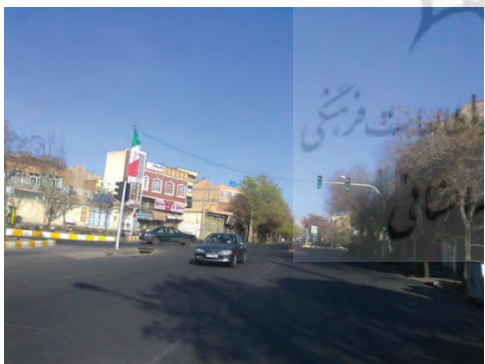
تصویر شماره (۸): قسمت‌هایی از خیابان شمس تبریزی تبریز

در آغاز دهه ۱۳۳۰، خیابان شهناز (شریعتی امروزی) از محله لیلوارو رو به شمال گشوده شد و بخش شمالی آن در بالای خیابان پهلوی تا دیگ‌باشی امتداد یافت و به انتهای غربی خیابان تربیت و ابتدای راسته کوچه متصل گردید. با احداث بخش شمالی خیابان شهناز (که دقیقاً از نقطه‌ای که پیش‌تر دروازه مهادمهین در آن قرار داشت می‌گذشت) کلیسای پروتستان که در مسیر خیابان قرار گرفته بود تخریب گردید و بخشی از زمین آن در ضلع غربی خیابان باقی‌ماند. این کلیسا، بعدها در سال ۱۳۳۵ در نقطه دیگری در جنوب محله ارمنستان از نو ساخته شد و در زمین باقیمانده از محل سابق آن در خیابان شهناز شمالی نیز در سال ۱۳۴۲، مجموعه هتل و سینما آسیا (آذربایجان امروزی) احداث گردید. این خیابان در مسیری از شمال به جنوب با خیابان‌های بازار، امام خمینی، هفده شهریور و آزادی (کمربندی) تقاطع دارد. امروزه خیابان شریعتی به‌عنوان یکی از کانون‌های خرید واقع در بافت قدیم کلانشهر تبریز شناخته می‌شود.