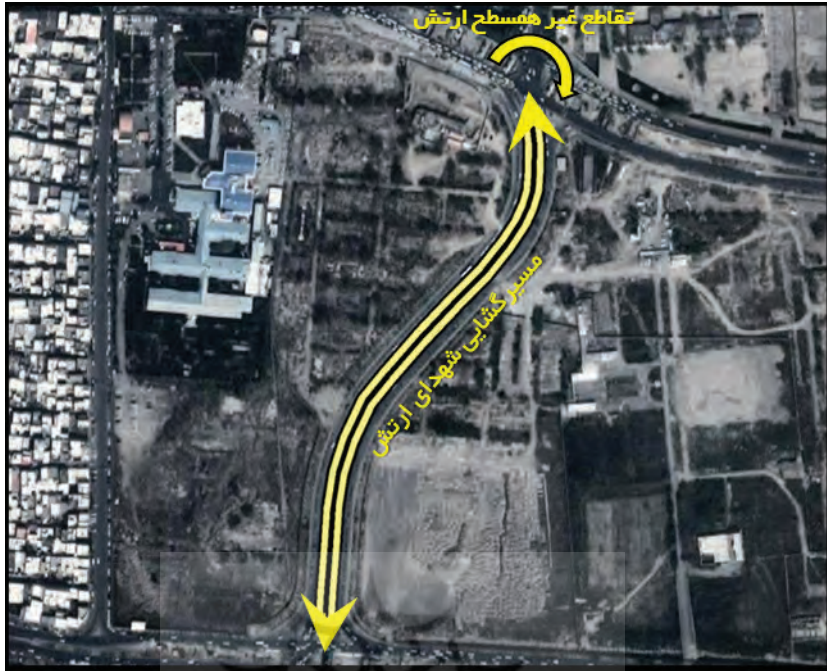
تصویر شماره (۱۸): مسیر گشایی شهدای ارتش و احداث تقاطع غیر همسطح ارتش

مسکونت شهروندان تبریزی مسیحی شامل آشوریان و ارمنی‌ها بوده است. در امتداد محله قدیمی بارون آواک کوچه والمان واقع شده است.