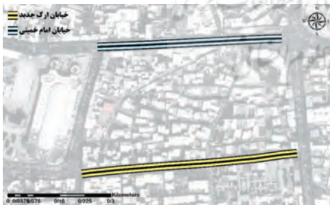
تصویر شماره (۱۳): موقعیت دو خیابان ارک جدید و امام خمینی

خیابان‌های شکل گرفته در دوره‌های گذشته از لحاظ عملکردی و معنایی مورد اقبال واقع شده و توانسته‌اند زمینه رضایت شهروندان را فراهم کنند از مسائلی است که جای تحلیل و ارزیابی دارد. در جهت تبیین عامل "تغییر در هندسه معنایی شهر" به مقایسه خیابان امام خمینی (پهلوی سابق) که در زمان پهلوی اول احداث شده با خیابان ارک جدید که در دو دهه اخیر با عنوان مسیر گشایی در بافت شهری تبریز ایجاد گردیده، پرداخته شده است. دو خیابان امام خمینی و ارک جدید در تبریز بافاصله زمانی بیش از ۸۰ سال به موازات هم و در یک محله یعنی نوبر ساخته شده‌اند. محله نوبر بخش‌های جنوبی بافت شهر را در غرب خیابان در برمی‌گیرد. قسمت بسیار کوچکی از آن در پیرامون دروازه نوبر در درون بارو قرار داشته است و «مقصودیه» شناخته شده‌ترین کوی آن است (صفامنش و همکاران، ۱۳۷۶: ۴۲-۴۳). این محله از شمال به محلات راسته کوچک و مهادمهین (میارمیار) و از جنوب به کوه‌های یانق، از مشرق به محله مارالان و از مغرب به چرنداب و مهادمهین محدود است. مرکز محله آن میدان مقصودیه است که به عنوان مفصل محله عملکرد دارد.