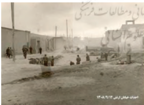
تصویر شماره (۶): احداث خیابان شاهپور (ارتش) سال ۱۳۰۸ شمسی

در سال پایانی این دوره، احداث خیابان شاه بختی (جمهوری امروزی)، حذف‌اصل خیابان خاقانی و فردوسی در دستور کار شهرداری قرار گرفت. در همین رابطه، روزنامه اطلاعات خبر می‌دهد: "... بلدیة شهر شروع به خاک‌ریزی خیابان مقابل عمارت ایالتی را نموده ... و چند ماه بعد در خبری دیگر آمده است: "... همچنین جهت ساختمان خیابان جلوی شمس‌العماره اقدام و مشغول کار هستند."