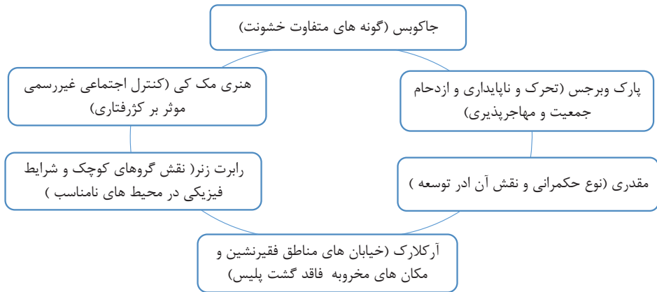
شکل شماره (۲): نظریه های ناامنی در فضای بی دفاع

مقاله از روش کتابخانه ای و با استناد به کتب و نظریات صاحب نظران، مقالات و پژوهشات انجام گرفته استفاده شده است که بر مطالعه هدفمند و نظام مند منابع مبتنی است و محور آن جستجوی توصیفی و اسنادی است؛ اما می توان با آن به تحلیل تبیینی دست زد و پرسش های چرایی را پاسخ داد و نوعی تبیین تفسیری نه اثبات گرایانه ارائه کرد (صادقی فسایی، ۱۳۹۴: ۱۲). این پژوهش به این نکته اشاره دارد که ضمن ترکیب نظرات حاصل از گردآوری منابع از طریق پژوهش ها و مقالات مورد مطالعه، در زمینه مسائل شهری به فضای تعاملی و کنشی محیط، فضا، مکان و انسان ها نیز نظر ویژه داشته و همچنین به مسئله مهم حکمرانی و تأثیر آن بر روند فضاهای شهری به ابعاد امنیت و ناامنی فضا اشاره داشته است؛ که حکمرانی خوب می تواند فضای بی دفاع شهری را به فضای قابل دفاع و مکان های امن تغییر دهد و معکوس آن امنیت شهری را به مخاطره اندازد.