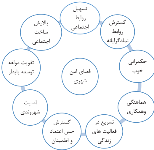
شکل شماره (۴): فضای امن شهری