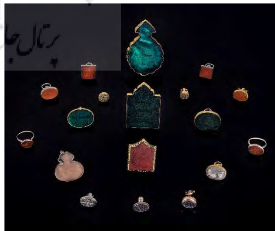
تصویر ۲. تعدادی از مهرهای دیوانی آستان علی بن موسی الرضا ۷ .

به هر صورت، منظور از نوشتن این مقاله بررسی ویژگی‌های ظاهری و هنری مهرهای دیوانی آستان علی بن موسی الرضا ۶ است. تصاویر این مهرها که از آرشیو مجموعه مذکور در اختیار نگارنده قرار گرفته به طور کلی شامل ۱۸ عدد نگین و