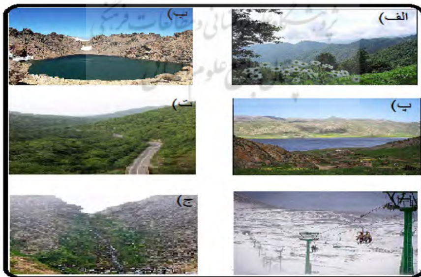
شکل ۳. ژئومورفوسایت‌های منطقه مورد مطالعه (الف: جنگل فندقلو - ب: دریاچه سبلان - پ: دریاچه نئور - ت: گردنه حیران - ث: پیست اسکی آلوارس - ج: آبشار سردابه)