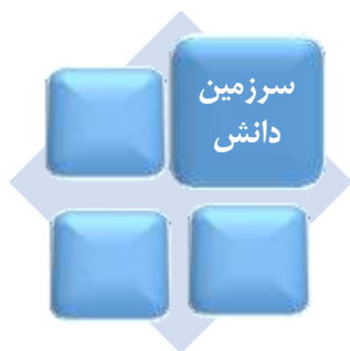
شکل ۱. ماتریس سناریو

سناریوی اول سیاست های تحول آفرین + به کارگیری تکنولوژی های نوین