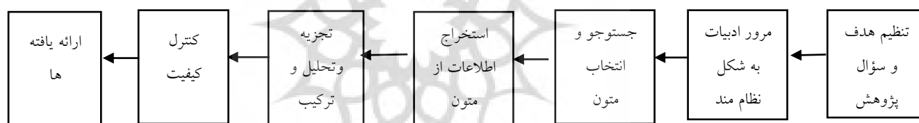
شکل ۱. گام‌های متوالی روش فراترکیب

فراترکیب نوعی مطالعه کیفی است که اطلاعات و یافته‌های استخراج شده از سایر مطالعات کیفی مرتبط با موضوع و مشابه آن را بررسی می‌کند و با فراهم کردن نگرشی نظام‌مند برای محققان، به کشف موضوعات جدید می‌پردازد (ثورن، جنسن، کرنی، نوبلیت و ساندلوسکی، ۲۰۰۴). در روش فراترکیب با تفسیر و مقایسه مطالعات متنوع، یک چارچوب مفهومی و دانش جامع ارائه می‌شود (برگدا، ۲۰۱۹). هنگامی که داده‌های انباشته شده و پراکنده بسیاری درباره موضوع پژوهش وجود دارد که نیازمند بازپردازش و کشف روابط معنادار جدید هستند. فراترکیب یک روش منسجم برای انجام این امر است. بدین صورت که پژوهشگر یک سؤال پژوهش را شناسایی و مطرح نموده و سپس به جست‌وجو، انتخاب، ارزشیابی و ترکیب داده‌ها می‌پردازد؛ بنابراین، یافته‌های مطالعات پیشین با موضوع و هدف مرتبط، مورد سازمان‌دهی مجدد قرار می‌گیرند (ساندلوسکی و باروسو، ۲۰۰۷). به بیان دیگر، رویکرد فراترکیب، نوعی روش تحقیق اکتشافی به منظور ایجاد و استخراج چارچوب مرجع مشترک برای نتایج تحقیقات گذشته است که تحقیقات کیفی مجزا را با فرایند ترجمه و ترکیب در سطحی انتزاعی گردآوری می‌کند. فراترکیب فرایند جست‌وجو، ارزیابی، ترکیب و تفسیر تحقیقات کیفی در یک حوزه خاص است (سهرابی، خلیلی و رودی، ۱۳۹۶). در روش فراترکیب بایستی تصور واضحی از هدف انجام تحقیق وجود داشته باشد (تورن، ۲۰۱۷). شناخته‌شده‌ترین الگوهای پیاده‌سازی روش فراترکیب شامل الگوی سه مرحله‌ای نوبلیت و هیر ۵ (۱۹۸۸)، الگوی شش مرحله‌ای والش و داون ۶ (۲۰۰۵) و الگوی هفت مرحله‌ای ساندلوسکی و باروسو (۲۰۰۶) است.