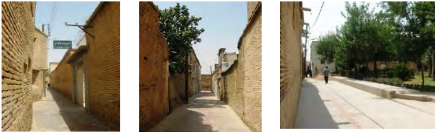
تصویر ۱: کیفیت‌های فضایی گذر اکباتان