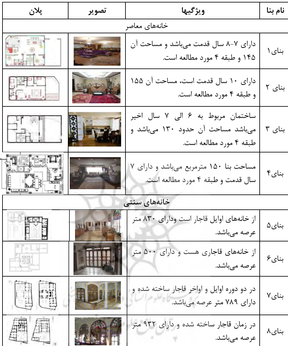
جدول شماره (۱): مشخصات بناهای مورد مطالعه