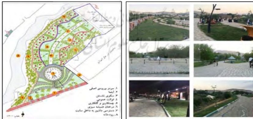
شکل ۲: تصاویر و پلان مربوط به پارک خانواده شهر مهاباد