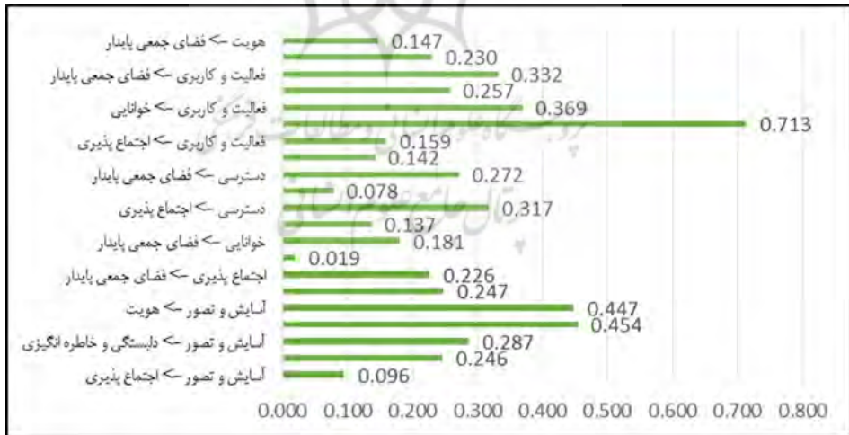
شکل ۴- نمودار اثرات متغیرهای مورد مطالعه بر متغیرهای میانجی و پایداری فضای جمعی

پارک خانواده شهر مهاباد