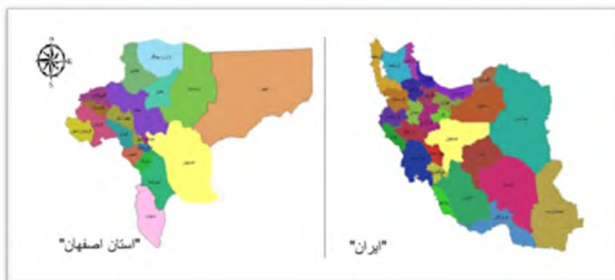
شکل ۱: موقعیت استان و شهرستان‌های اصفهان