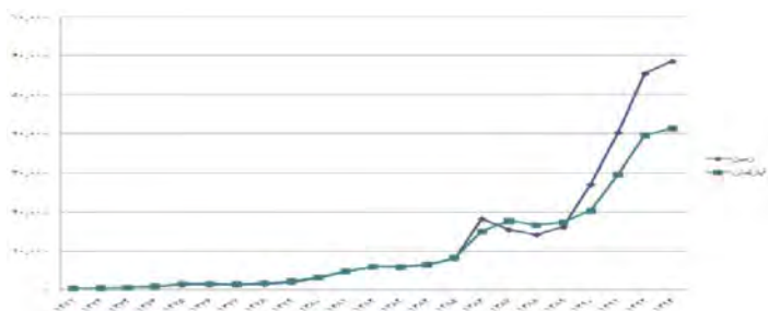
شکل شماره ۱: متوسط قیمت زمین و مسکن در تهران (هزار ریال در متر مربع). کارگزاری مشاوران سهام، ۱۳۹۴: ۳

همانطور که در جدول و شکل شماره ۱ مشخص است، بیشترین دلیل رشد قیمت آپارتمان رشد قیمت زمین می‌باشد. با مقایسه دو متغیر قیمت زمین و ساختمان به این نتیجه می‌رسیم که رشد قیمت زمین از رشد قیمت آپارتمان بیشتر بوده است. قیمت آپارتمان از سال ۷۰ در شهر تهران حدود ۸۷ برابر شده است؛ در حالی که قیمت زمین در همین بازه زمانی ۱۳۶ برابر شده است. با توجه به طرح مسائل فوق، پژوهش حاضر قوانین و سیاست‌های زمین شهری را، از رویکرد مقابله با تقاضاهای سوداگرانه زمین شهری در کلانشهر تهران بررسی کرده است. به عبارت دیگر، بررسی سیاست‌ها و قوانین زمین شهری از منظر مقابله با سوداگری در این بخش درک مناسبی در مورد نگاه حاکم بر سیاست‌ها و الگوهای اداره‌ی مسائل زمین و مسکن شهری در این منطقه شهری فراهم می‌آورد که در این نوشتار به صورت مبسوط به آن پرداخته می‌شود.