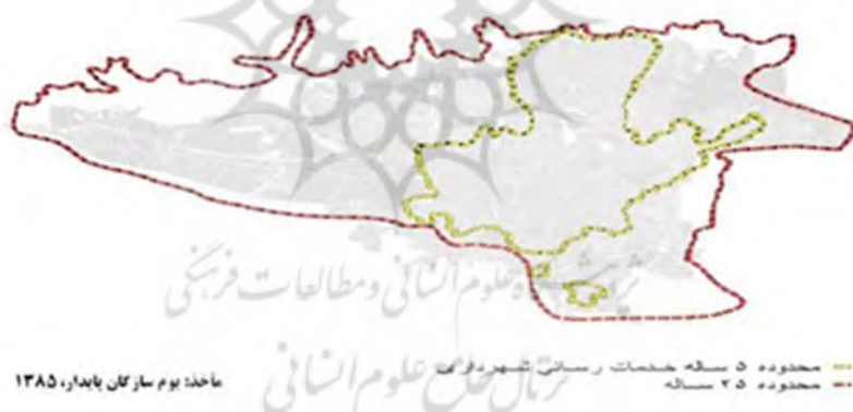
شکل شماره ۴: محدوده‌های پیشنهادی در طرح جامع اول تهران.

۱۷۲). برای اولین بار در برنامه عمرانی سوم پیش از انقلاب به ضرورت تهیه طرح جامع شهری با هدف تنظیم و پیش‌بینی توسعه زیربنای شهر در قالبی منطقی پرداخته شد. چنین طرح‌هایی مداخله‌ی مقطعی دولت در بازار زمین را به صورت مداخله‌ای همه‌جانبه و درازمدت درآورد. این مداخله شامل تنظیم بازار زمین در محدوده داخلی شهر از طریق تعیین کاربری، تراکم و منطقه‌بندی شهر و مداخله در عرضه زمین جدید از طریق تعیین جهت گسترش و محدوده‌های قانونی بود (غمامی و همکاران، ۱۳۸۶: ۴۶-۴۵). از زمان اجرای ضوابط اولین طرح جامع تهران از سال ۴۷، نقاط سکونتی خودرو و غیررسمی در پیرامون تهران شکل گرفت که در سالهای بعدی تبدیل به شهر شدند. اعمال مقررات و کنترل شدید ساخت و ساز از طرف دولت از این سال، باعث انتقال جمعیت به مناطق پیرامونی شهر و خارج از حریم استحفاظی شهر و ساخت و سازهای بی‌رویه در این مناطق گردید (نظریان، ۱۳۸۱: ۶۱). تقسیم شهر به دو محدوده ۵ ساله و ۲۵ ساله در طرح جامع (شکل شماره ۴) و ممنوعیت ساخت و ساز در محدوده ۲۵ ساله و سخت‌گیری در مقررات ساخت و ساز در محدوده ۵ ساله و ادامه سرمایه‌گذاری‌های سنگین در عمران شهری تهران سبب شد تا مردم تهران شاهد پدیده جدید اجتماعی به نام محدوده و خارج محدوده باشند.