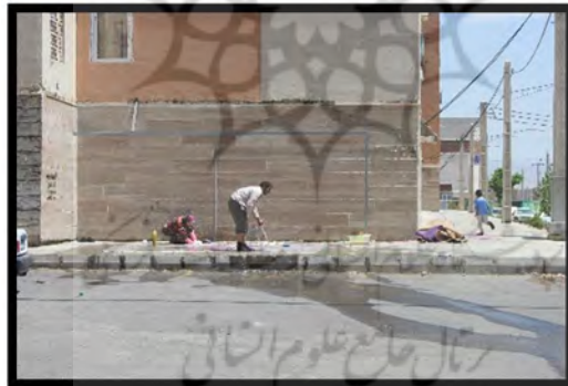
تصویر شماره ۹. کد رفتاری I.