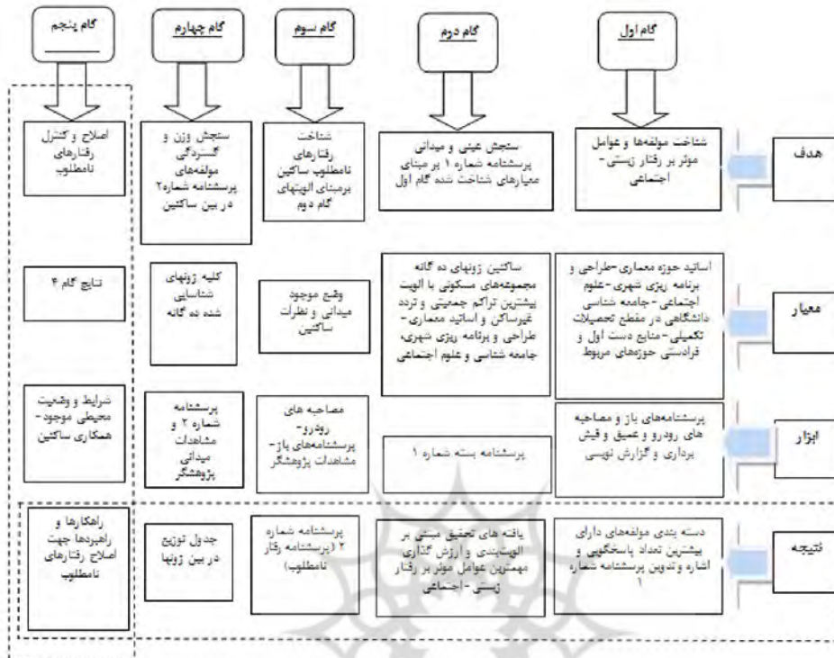
شکل شماره ۱. فرآیند انجام پژوهش.