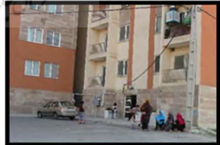
تصویر شماره ۳. کد رفتاری A. مأخذ: نگارندگان تصویر شماره ۴. کد رفتاری B. مأخذ: نگارندگان